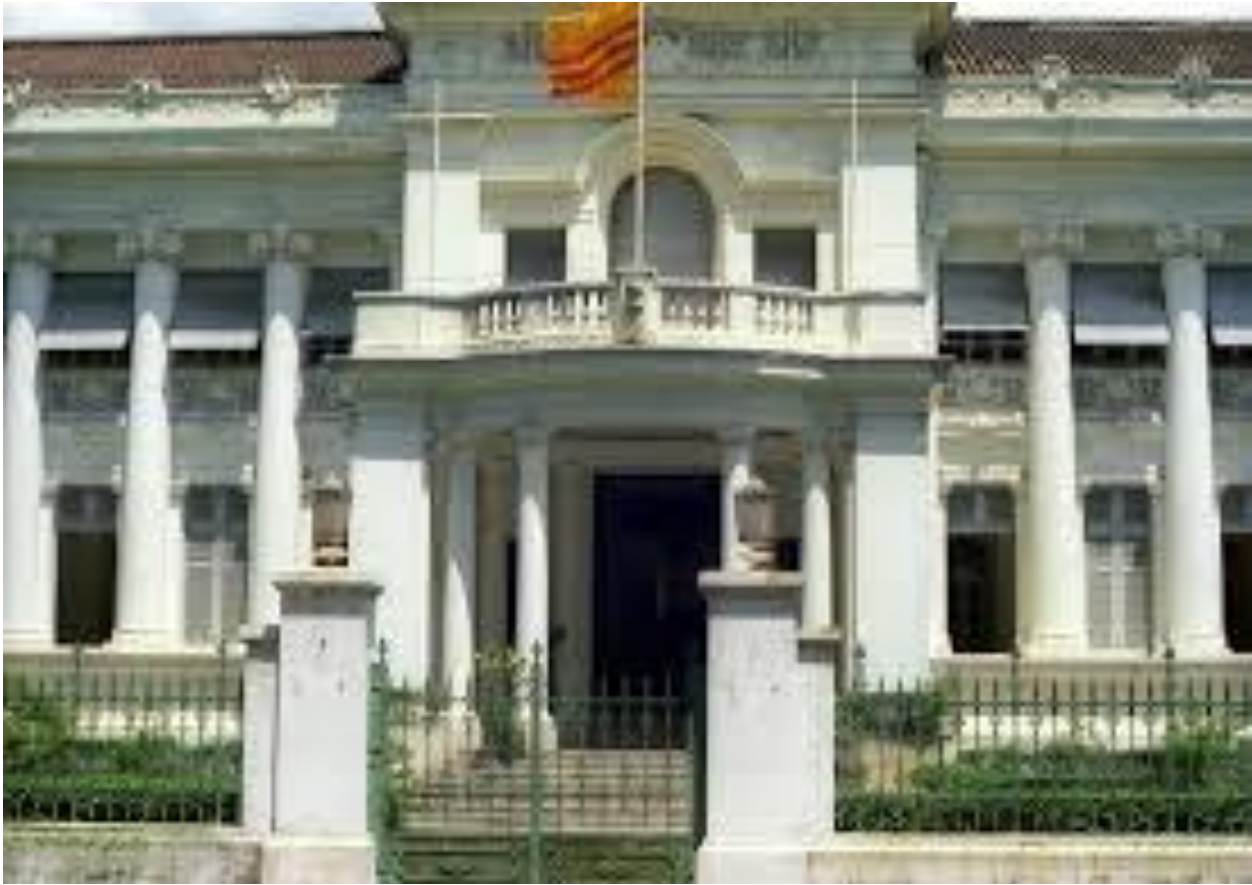
Dinh Độc Lập