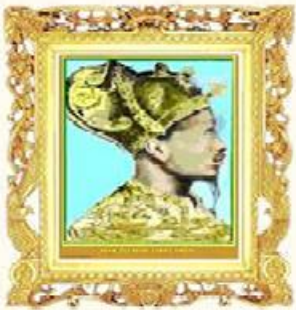
VUA TỰ ĐỨC VÀ VẠN NIÊN CỐ

Trong việc đối phó với tình hình đất nước thời ấy, nhất là trước áp lực của ngoại bang, thì chỉ có vua Tự Đức, triều đình Huế, và Phan Thanh Giản. Đây là 3 yếu tố đóng vai trò chịu trách nhiệm trước lịch sử. Vua Tự Đức là một nhà thâm nho, lấy Tứ Thư, Ngũ Kinh làm mẫu mực; đặc biệt Vua lấy đạo hiếu làm đầu, đúng theo tinh thần Nho Giáo. Suốt 36 năm trị vì, Vua dành ngày chẵn để hầu mẹ, nghe lời dạy bảo của mẹ là Đức Từ Dụ; và ngày lẻ thì mới ngự triều. Từ thời Gia Long, nước ta xem là một chư hầu của Trung Quốc, luôn có sứ sang Tàu và nhận ấn tín của Hoàng Đế nhà Thanh. Đặc biệt vua Tự Đức nghĩ là phương Tây kém văn minh. Giữa triều Tự Đức, trước sự áp đảo của phương Tây, nhà vua càng trông mong vua nhà Thanh giúp đỡ, nên cho đi sứ sang Tàu thường xuyên, mang nhiều báu vật để triều cống. Tốn kém hơn nữa, là việc phải bồi thường cho Pháp và Tây ban Nha theo hoà ước Nhâm Tuất ký năm 1862. Trong nước có nhiều nội loạn, dân tình khổ sở, mà Vua còn cho xây Khiêm Lăng, kiến trúc vô cùng vĩ đại khiến dân chúng phải đóng góp rất nhiều (1864-1867). Khiêm Lăng còn có tên 'Vạn Niên, vì lẽ: Vua có 103 Vợ và thứ phi mà vẫn không có con để truyền ngôi, nên vua nghĩ là chỉ có chết mới trường cửu. Dân tình ta thán lẩm, nên có câu ca dao: "Vạn niên là vạn niên nào. Thành xây xương lính, đào hào máu dân". Còn dân miền Nam, văn chương mộc mạc hơn, thì hát "Chiều chiều bắt kết nhỏ lông. Kết kêu bớ Tự, sao mầy bắt nhân!"