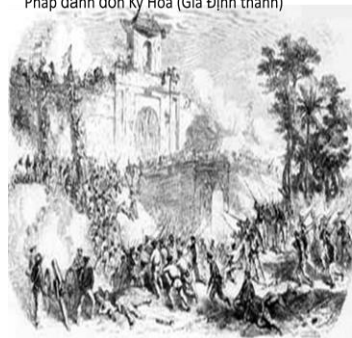
Pháp đánh đồn Kỳ Hoà (Gia Định thành)