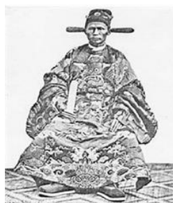
PHÓ SỨ PHẠM PHÚ THỮ VÀ CHÁNH SỨ PHAN THANH GIẢN

Tự Thán Từ ngày đi sứ đến Tây Kinh Thấy việc Âu Châu phải giựt mình Kêu rú đồng ban mau thức dậy Hết lời năn nỉ chẳng ai tin.