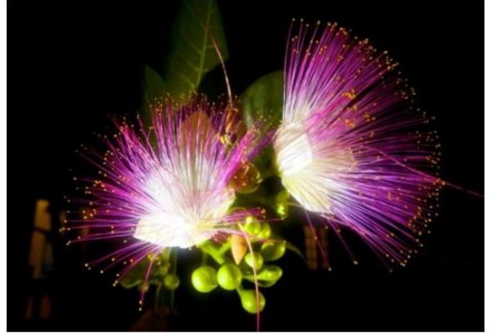
Hoa bàng vuông, nét đẹp độc đảo của Trường Sa.

Đá Cô Lin thuộc Quần đảo Trường Sa. Nơi đây ngày 14/3/1988 Hải quân TQ và Hải quân VN đã có 1 trận thương vong quyết liệt để giành quyền kiểm soát nhóm bãi đá: Đá Gạc Ma, Đá Cô Lin và Đá Len Đao. Trong trận này TQ bị hư 2 tàu chiến, chết 24 thủy binh, VN mất 3 tàu vận tải và 64 thủy binh. Kể từ đó TQ chiếm đóng Đá Gạc Ma. Hai bãi Đá Cô Lin và Đá Len Đao VN giữ được. Sau đó VN đã cho xây công sự chiến đấu và pháo đài trên những bãi đá này.