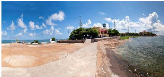
Đảo Trường Sa Đông

Bên trái là cầu tàu, chính giữa là đường băng cho máy bay hạ cánh và phía bên phải có ngọn hải đăng. Đảo này nằm cách Cam Ranh, VN 254 hải lý, tương đương 470km, cách Vũng Tàu hơn 500km. Đảo này dài 630m, chỗ rộng nhất là 300m.