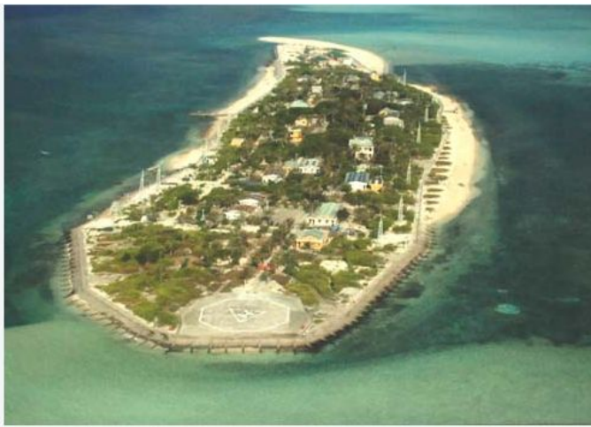
Đảo Nam Yết thuộc quần đảo Trường Sa.