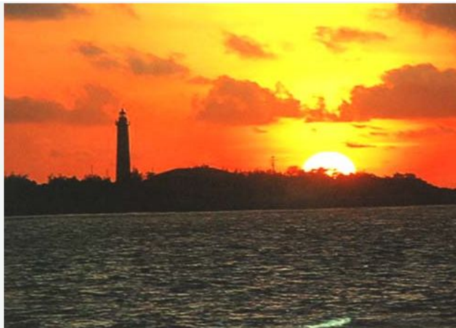
Bình minh trên đảo Song Tử Tây thuộc quần đảo Trường Sa.