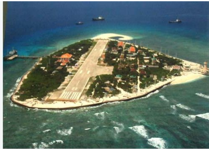
Đảo Trường Sa Lớn thuộc quần đảo Trường Sa nhìn từ trên cao.

Dưới đây là những đảo và bãi đá trong Quần Đảo Trường Sa hiện do Việt Nam kiểm soát thuộc quyền quản lý của Tỉnh Khánh Hoà, Việt Nam.