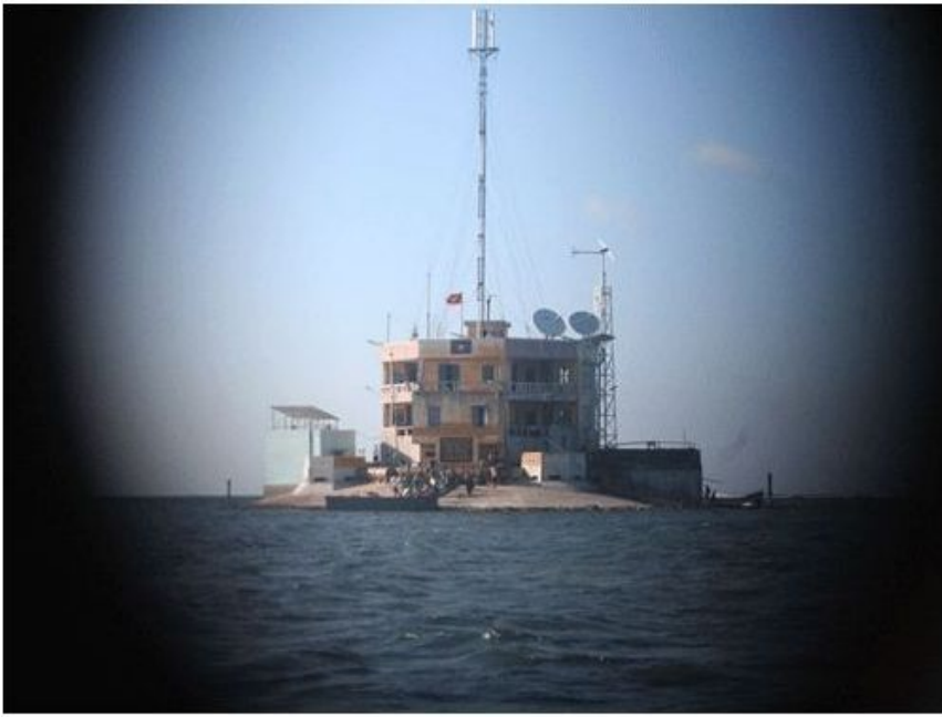
Đảo Tiên Nữ