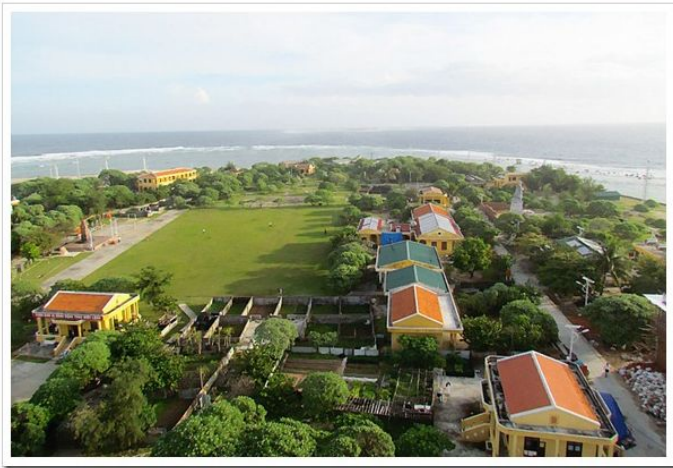
Đảo Song Tử Tây nhìn từ trên cao