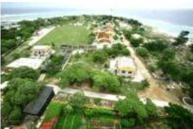
Bãi Vững Mây

Hòn đảo có cái tên thật kiêu sa này, cách đất liền Việt Nam gần 400 hải lý, tương đương 750km. Đây là điểm xa nhất về phía đông của Việt Nam. Nơi đây đón nhận tia nắng bình minh sớm nhất của VN. Chuyện kể rằng, xưa kia có một nàng tiên đẹp tuyệt trần, trên bước đường phiêu du nơi trần thế, rặng san hô tuyệt đẹp của hòn đảo này đã khiến nàng vô cùng thích thú. Nàng quyết ở lại nơi này để nghỉ ngơi và dùng phép thuật của mình cứu giúp những ngư dân gặp nạn trên vùng biển Trường Sa. Đó là câu chuyện cổ tích, người tin kẻ không, dầu vậy nét huyền bí trong tên gọi mãi mãi là lực hấp dẫn đầy lý thú cho những ai chưa từng đặt chân đến hòn đảo này.