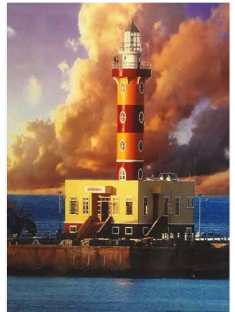
Đèn biển trên đảo Sơn Ca thuộc quần đảo Trường Sa.

Trước đây, đảo Nam Yết chỉ bạt ngàn dừa, mu u, nhào, phong ba và là nơi nhiều loài chim biển sinh sống. Bàn tay cần cù của con người đã xây dựng nên một hòn đảo sạch đẹp, trong lành như ngày nay.