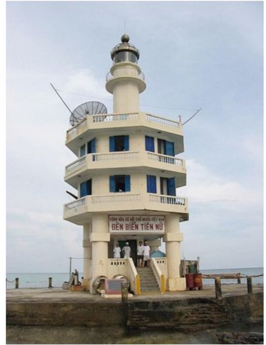
Hải đăng trên đảo Tiên Nữ

Hòn đảo có cái tên thật kiêu sa này, cách đất liền Việt Nam gần 400 hải lý, tương đương 750km. Đây là điểm xa nhất về phía đông của Việt Nam. Nơi đây đón nhận tia nắng bình minh sớm nhất của VN. Chuyện kể rằng, xưa kia có một nàng tiên đẹp tuyệt trần, trên bước đường phiêu du nơi trần thế, rặng san hô tuyệt đẹp của hòn đảo này đã khiến nàng vô cùng thích thú. Nàng quyết ở lại nơi này để nghỉ ngơi và dùng phép thuật của mình cứu giúp những ngư dân gặp nạn trên vùng biển Trường Sa. Đó là câu chuyện cổ tích, người tin kẻ không, dầu vậy nét huyền bí trong tên gọi mãi mãi là lực hấp dẫn đầy lý thú cho những ai chưa từng đặt chân đến hòn đảo này.