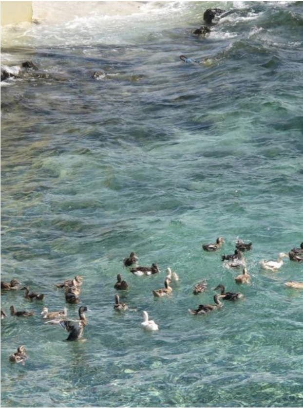
Những đàn vịt đồng dập dềnh trên sóng biển đảo đá Tây

Đá Cô Lin thuộc Quần đảo Trường Sa. Nơi đây ngày 14/3/1988 Hải quân TQ và Hải quân VN đã có 1 trận thương vong quyết liệt để giành quyền kiểm soát nhóm bãi đá: Đá Gạc Ma, Đá Cô Lin và Đá Len Đao. Trong trận này TQ bị hư 2 tàu chiến, chết 24 thủy binh, VN mất 3 tàu vận tải và 64 thủy binh. Kể từ đó TQ chiếm đóng Đá Gạc Ma. Hai bãi Đá Cô Lin và Đá Len Đao VN giữ được. Sau đó VN đã cho xây công sự chiến đấu và pháo đài trên những bãi đá này.