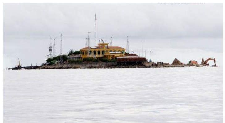
Đảo Phan Vinh can trường trong gió bão.

“Cô gái” Sơn Ca nằm nghiêng mình giữa trời, biển, duyên dáng và đẹp tình khiết như trong cổ tích.