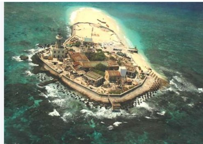
Đảo An Bang thuộc quần đảo Trường Sa.