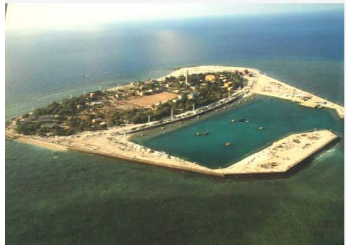
Đảo Song Tử Tây thuộc quần đảo Trường Sa.

Đảo Trường Sa Lớn thuộc Quần Đảo Trường Sa nhìn từ cầu tàu. Các cột màu trắng nhô lên cao là hệ thống năng lượng mặt trời cung cấp điện 24/24 cho toàn đảo.