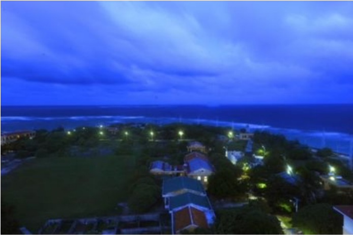
Lung linh xã đảo lên đèn.

Đảo An Bang dài 200m, rộng 20m, diện tích đảo gần 2 hecta. Trên đảo có 1 ngọn hải đăng. Đảo này là nơi chịu nhiều sóng gió ác liệt nhất của quần đảo Trường Sa.