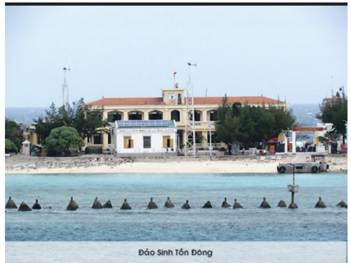
Đảo Sinh Tồn Đông

Đảo Sinh Tồn Đông cách đất liền VN 320 hải lý, tương đương 592km. Tháng 2/1978, Philippines đã đưa quân chiếm đóng đảo Panata mà VN gọi là cồn san hô Lan Can gần Đảo Sinh Tồn Đông, đồng thời Philippines tăng cường các hoạt động thăm dò, trinh sát quanh khu vực Đảo Sinh Tồn Đông. Nhưng phía VN cũng tăng cường lực lượng phòng thủ và hiện vẫn kiểm soát Sinh Tồn Đông.