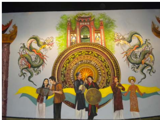
Lễ Hội Đền Hùng Tranh vẽ của Họa sĩ Mạc Chánh Hòa

Giỗ Tổ Hùng Vương là một lễ hội truyền thống tự ngàn xưa để cho mọi người cùng hướng tầm nhìn về thời Ông Tổ của cả nước khai sơn phá thạch, lập nước truyền thừa 18 chi Vua Hùng giữ nước an dân. Giỗ Tổ Hùng Vương là một lễ hội dân gian được tổ chức trên toàn quốc và cả ở hải ngoại, cho ta có dịp gặp gỡ nhau và hướng về nguồn cội, nhìn thấy lại những gương anh hùng anh thư cùng chiến đấu bảo vệ bờ cõi nước ta. Từ sự ngưỡng phục, chúng ta tri ân bao đời chiến đấu kiên hùng với tinh thần bất khuất của biết bao thế hệ tiền nhân đã xả thân cho Nước Việt tồn tại mãi tới ngày nay.