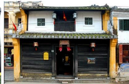
Nhà cổ Tấn-Ký