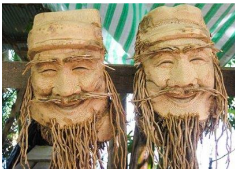
Mặt nạ dừa Bến-Tre

Riêng lều hàng nhỏ bán đồ kỷ niệm của tôi đây cũng vậy, tôi chỉ bày bán sản phẩm nội địa chứ không bao giờ chịu lãnh mỗi sản phẩm ngoại nhập trá hình dù cho có mức lời cao hơn. Vì theo thiên ý ngu dốt của tôi, thì bán đồ kỷ niệm ngoại nhập trá hình là chẳng khác nào mình vô tình đánh lừa du khách đến nước ta mà không tìm được những kỷ niệm gì do chính người dân ta sản xuất. Nếu nay mai họ biết được, thì chắc chắn họ sẽ có những ấn tượng không mấy đẹp về ý nghĩa của một chuyến đi.