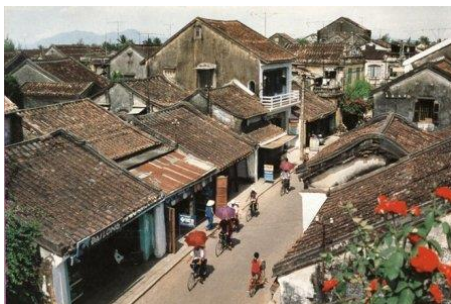
Phố cổ Hội-An

** - Hai ngôi nhà cổ Phùng-Hưng và Tấn-Ký ở Hội-An là những di tích lịch sử nổi tiếng, từng đã được các yếu nhân cũng như nguyên thủ quốc gia nước ngoài tìm đến tham quan.