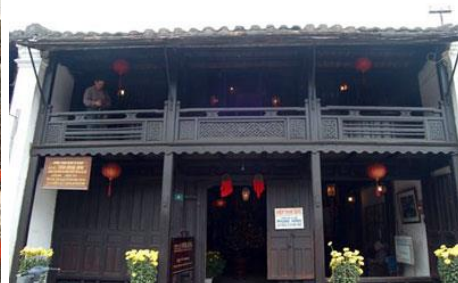
Nhà cổ Phùng-Hưng