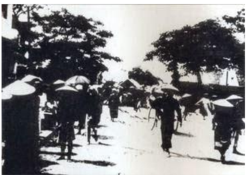
Cuộc nổi dậy ở Quỳnh Lưu 13-11-1956-(Nghệ An)

Sau cái gọi là Nghị quyết sửa sai của đảng CSVN về những đợt cải cách ruộng đất đẫm máu, các nạn nhân đã tìm những cán bộ thanh toán món nợ máu. Các đảng viên CS được thả về từ nhà tù, được khôi phục quyền hành, khôi phục đảng tịch, cũng liền tìm đến ngay các đồng chí đã vu cáo họ để trả thù. Họ đã dùng ngay chính sách sửa sai của CSVN để đòi lại chồng con đã bị giết oan uổng, tài sản đã bị cưỡng đoạt bất hợp pháp và đòi quyền được di chuyển tự do vào Nam như đã ghi trong Hiệp định Geneve 1954.