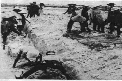
Một hầm chôn tập thể ở Huế được khai quật

Khi quân đội VNCH phản công và tái chiếm thành phố Huế, để dễ dàng và an toàn cho cuộc rút lui, chúng đã bắt những người dân mà chúng đang giam giữ, đào những hầm hố lớn, nói là, nói là để làm hầm trú ẩn. Đào xong, chúng xả súng bắn vào họ rồi lấp đất chôn họ luôn. Nhiều người chưa chết, chúng cũng chôn luôn.