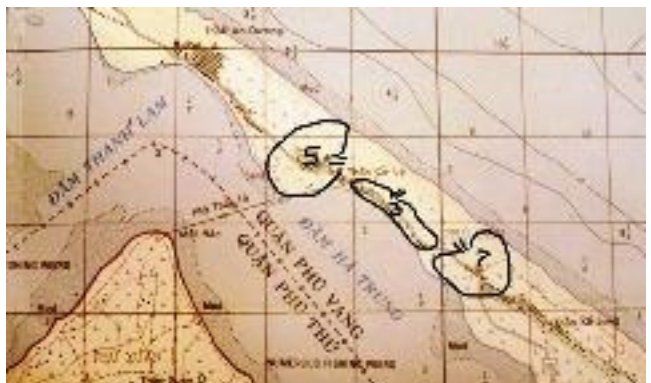
Vị trí của các TĐ TQLC

Đến trưa, gặp TĐ4/TQLC, tiểu đoàn cho lệnh dừng quân, lập tuyến phòng thủ ngay trên các đồi cát.