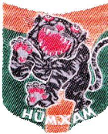
Tieu Doan 7 Hum Xam TQLC

Tôi hướng dẫn cho ông hệ thống phòng thủ, giao thông hào hình chữ Z, hầm hố cá nhân, những vị trí đặt súng nặng đại liên M60, những hầm hầm éch dưới giao thông hào sâu gần 2 mét để tránh pháo 130 ly và hỏa tiễn 122 ly. Tuyến phòng thủ là một đồi đá nhiều hơn đất, muốn lấy nước là phải theo những con đường đặc biệt từ trên đồi xuống thông thủy. Bàn giao cả những vị trí gài bẫy, gài mìn claymore, lựu đạn và có cả những vóng gác giá, lính giả để nghi binh... Ban ngày thấy vậy nhưng không phải vậy, ban đêm mà mò vào là biết thế nào là TQLC phòng thủ, biết thế nào là Sinh Bắc Tử Nam ngay... Bàn giao cho