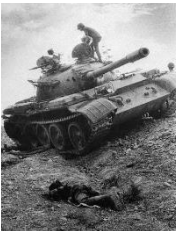
Chiến xa T54 của CSBV bị bắn cháy

Tôi còn nhớ thời gian ĐĐT về “hấp” ở TTHL Đống Đa tại Phú Bài, trong 1 buổi huấn luyện và thực tập bắn M72, tôi được chỉ định bắn M72 cho quân nhân trong ĐĐT xem. Với cự ly 150 mét, trời nắng, gió nhẹ, tầm quan sát rõ, tôi đã bắn bay mục tiêu là 3 cái thùng phuy tượng trưng cho T54. Đó là kết quả của những ngày thao trường đổ mồ hôi, công sức huấn luyện của các Đ/Úy Tôn, Đ/U Nhòng, Đ/U Thái, Đ/U Dục ... Xin thành thật cảm ơn quý vị, nhờ các vị huấn luyện đã tạo cho tôi niềm tự tin trước họng súng CX T54, tôi sẽ chờ chúng tới thật gần, vào tầm hủy diệt 99% của súng chống CX M72.