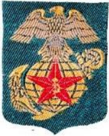
Phu Hieu Su Doan Thuy Quan Luc Chien Viet Nam Cong Hoa