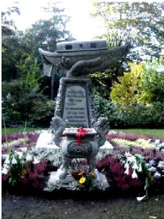
Tượng đài tưởng niệm Thuyền nhân Việt Nam tỵ nạn cộng sản tại nước Đức