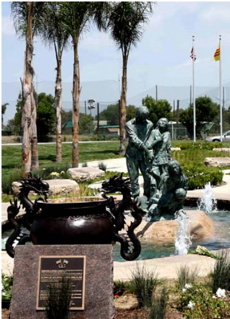
Tượng đài Thuyền nhân được thiết lập ở Nam California