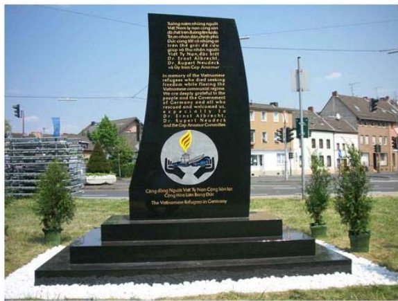
Tượng đài tưởng niệm Thuyền nhân Việt Nam ty nạn cộng sản tại nước Đức.