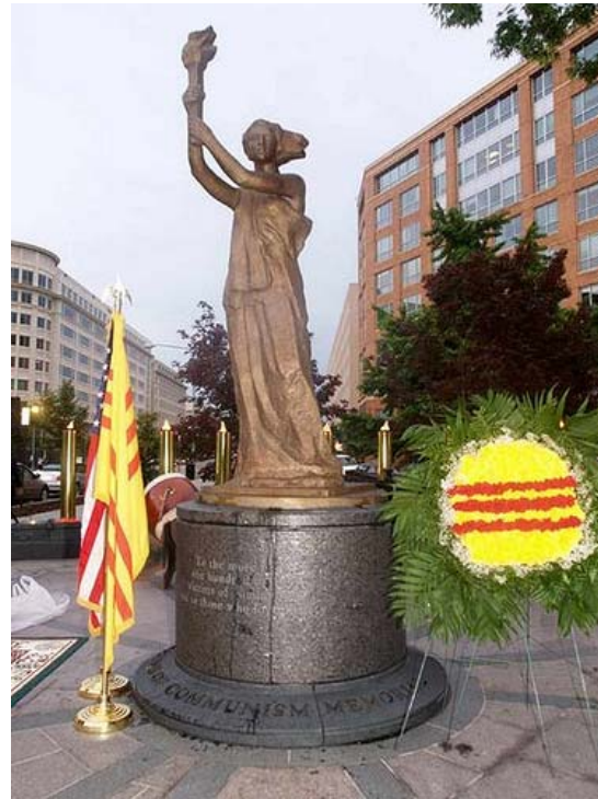
Tượng đài tưởng niệm nạn nhân Cộng Sản tại thủ đô Washington, Hoa Kỳ