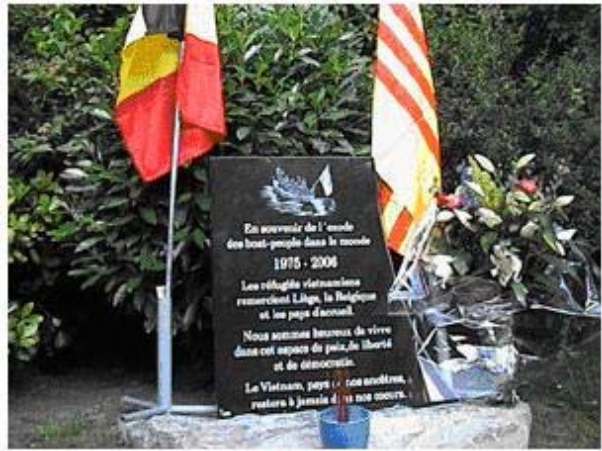
Tượng đài tưởng niệm Thuyền nhân Việt Nam tại đảo Bidong, Malaysia ..... và tại Bỉ