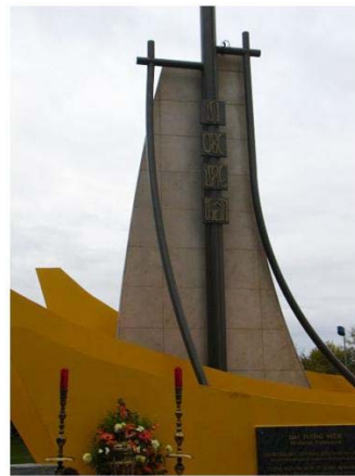
Tượng đài tưởng niệm Thuyền nhân Việt Nam ty nạn cộng sản tại nước Pháp.