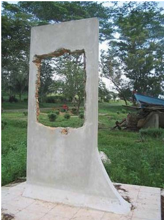
Bia đá Thuyền Nhân Việt Nam tại đảo Galang

đang tiếp tục được dựng lên trên khắp thế giới để tưởng nhớ nạn nhân của chế độ bạo tàn Cộng Sản.