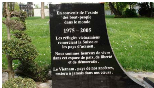
Đài tưởng niệm Thuyền Nhân ở Geneve, Switzerland

Tượng đài Thuyền nhân tỵ nạn cộng sản được thiết lập ở Nam California để tưởng nhớ đồng bào bỏ mình trên đường trốn chạy khỏi chính thể bạo tàn Cộng Sản . Hình ảnh này và rất nhiều tượng đài tưởng niệm nạn nhân Cộng Sản trên toàn thế giới sẽ là những vết nhớ không tẩy xóa được trong lịch sử nhân loại. Tội ác Cộng Sản Việt Nam: 16 bia đá ghi tên người Việt đã bỏ mình oan khuất, đau khổ trên đường trốn chạy chế độ man rợ, bạo tàn Cộng Sản VN.