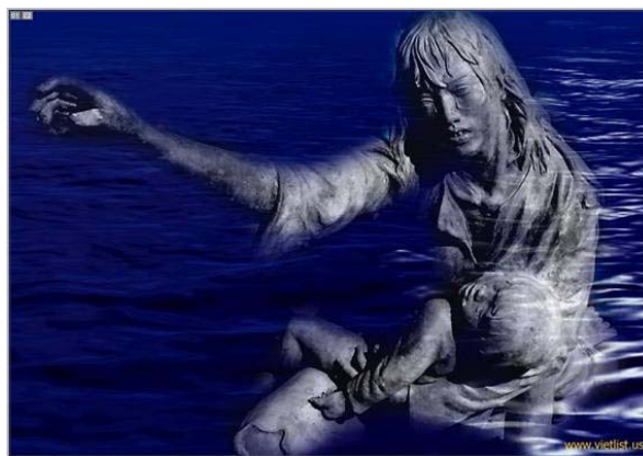
Hình ảnh hải hùng, tuyệt vọng của thuyền nhân được diễn tả dựa và Tượng đài Thuyền nhân ở Nam California.

Bia đá Thuyền Nhân Việt Nam tại đảo Galang, Indonesia, tưởng niệm những nạn nhân Cộng Sản đã đến được bến bờ tự do hoặc đã bỏ thân trên biển cả. Trại tị nạn Galang trên một hòn đảo ở Indonesia đã đón tiếp khoảng nửa triệu thuyền nhân Tỵ nạn Cộng Sản vào các năm 1978-1990. Việt Cộng đã làm áp lực với chính quyền Indonesia đục bỏ những dòng chữ ghi chép tưởng niệm thuyền nhân. Tuy nhiên hành động kềm can đảm này không mang lại kết quả mong muốn cho một chính thể độc tài. Nhiều tượng đài, bia đá tưởng niệm khác đã và