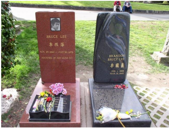
Mộ cha con Lý Tiểu Long – Lý Quốc Hào.