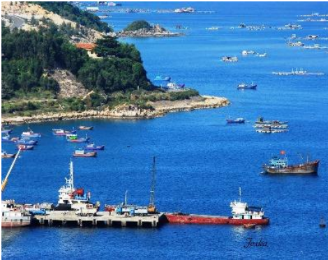
Vũng Rô (Phú Yên)

Ngày 12-2, trên trang Sputnik, viết rằng tình trạng “quân sự hóa” của Trung Quốc tại Biển Đông, là lý do khiến Mỹ bắt đầu thảo luận về khả năng điều động lực lượng và mở thêm căn cứ tại khu vực này.