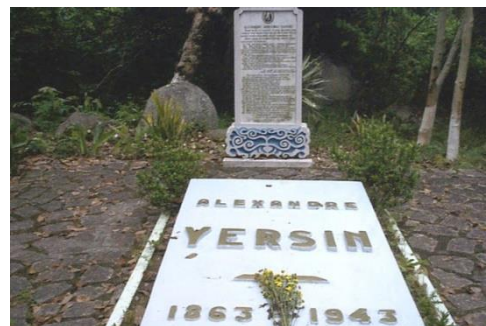
Mộ “Ông Năm” Yersin tại Suối Dầu, Nha Trang

Lycée Yersin (nay là Trường Cao đẳng Sư phạm Đà Lạt) là một ngôi trường được khởi công xây dựng năm 1927 và khai giảng năm 1935 là một kiến trúc đẹp và độc đáo của Đà Lạt.. Tại thành phố này, cũng mang tên ông còn có Công viên Yersin và một ngôi trường thành lập năm 2004, Đại học Yersin.