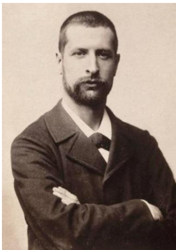
Alexandre Émile Jean Yersin (1863-1943)

Chính Pasteur viết thư đề cử Yersin làm bác sĩ chăm sóc sức khỏe cho hành khách và thủy thủ của tàu Messageries Maritimes chạy bằng buồm và hơi nước trên tuyến hàng hải Sài Gòn – Manila, chuyên chở 67 hành khách cùng vài tấn hàng hóa. Bác sĩ Albert Calmette (1863-1933), một môn đệ khác của Pasteur, đến Sài Gòn tìm gặp Yersin. Calmette đề nghị hợp tác trong việc thành lập chi nhánh Viện Pasteur ở Sài Gòn năm 1891, đây là Viện Pasteur đầu tiên ngoài nước Pháp của Viện Pasteur Paris.