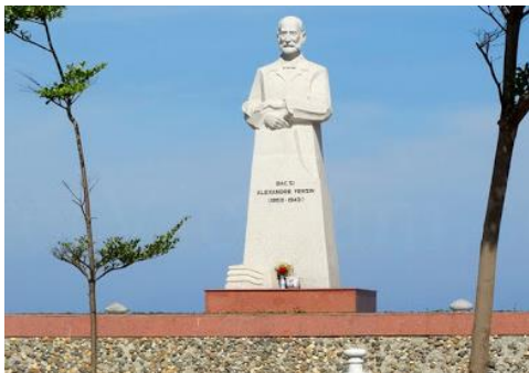
Tượng Yersin tại Nha Trang

Trong những ngày cuối đời, Yersin lại gắn bó với niềm đam mê mới: văn chương. Ở tuổi tám mươi, ông lại học tiếng Latin, tiếng Hy Lạp, và biên dịch những tác phẩm kinh điển của Phèdre, Virgile, Horace, Salluste, Cicéron, Platon, và Démosthène.