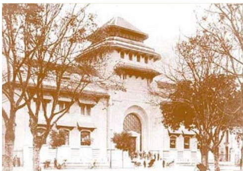
Đại học Y Hà Nội (năm 1930)

Yersin được bổ nhiệm làm hiệu trưởng đầu tiên của Trường Y Đông Dương, tiền thân của Đại học Y Hà Nội. Ông thiết lập giáo trình theo hình mẫu đại học Pháp – sáng khám bệnh ở bệnh viện, chiều dành cho lý thuyết – đích thân ông giảng dạy trong các giờ vật lý, hóa học, và phẫu thuật.