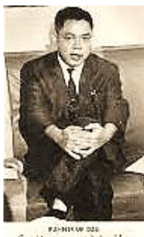
Luật sư Trương Đình Dzu