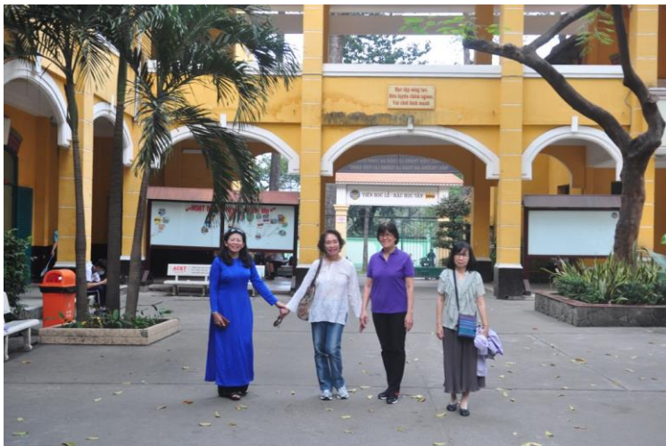
(Sân trường Trưng Vương- Photo: Vĩnh-Tường, 3/2018)

Đường Công Lý rồi Thống Nhất quẹo phải Nguyễn Bình Khiêm...dường như thấp thoáng đằng xa mắt thuyền tóc dài ôm cặp. Càng tới gần bóng ấy càng lùi xa băng ngang đường khuất sau hàng cây trò chỉ rồi khuất xa mãi mãi. May có ba cựu nữ sinh đón thăm trường nên cổng trường Trưng Vương tháng 3/2018 đỡ xa lạ huy hoắc bằng tên mới vàng giả chói lọi.