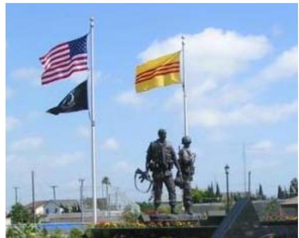
BS TÔ ĐÌNH ĐÀI

Nhìn về tương lai, cùng một hướng đi Dắt dìu nhân loại, quản gì khó khăn. ! Mối tình VIỆT MỸ ghi đậm vàng trắng Bình minh nở rộ, quả đất tròn long lanh !