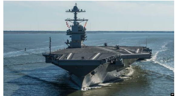
Hàng không mẫu hạm USS Gerald R. Ford