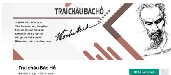
Một group trên Facebook có tên “Trại Cháu Bác Hồ” và Năm điều Bác Hồ dạy.