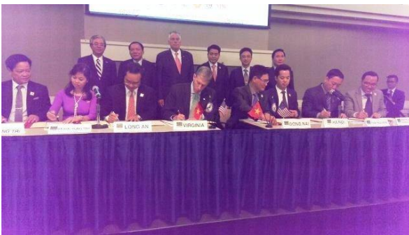
Lễ ký kết thỏa hiệp để phát triển doanh thương giữa sáu tỉnh ở Việt Nam và Hoa Kỳ tại Tiểu Bang Virginia ngày 11.7.2017