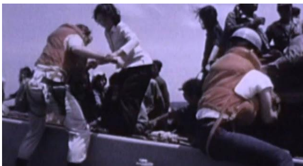
Thủy thủ tàu Mỹ cứu người tỵ nạn trên biển

“Điều đó khiến tôi tự hào là một thủy thủ Hoa Kỳ... tự hào là người Mỹ! Chúng tôi đã vớt họ... hỗ trợ y tế và đưa họ đến tận cổng nhập cảnh để vào Hoa Kỳ... Đó là nhiệm vụ của người thủy thủ và đó cũng là luật pháp quốc tế: Con người trên biển cả, nếu có điều gì đó xảy ra cho họ thì đạo đức và lương tâm sẽ ràng buộc họ với chúng tôi...”