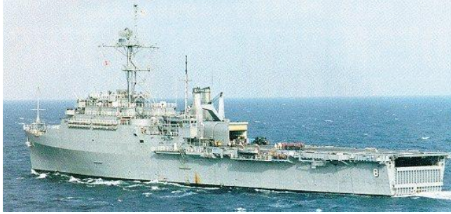
USS Dubuque (LPD-8)

vào tháng 2/1989. Đây cũng là một án lệ về đạo đức, làm gương cho những thuyền trưởng trong Hải quân Hoa Kỳ. Sau khi được hạ thủy ngày 1/9/1967, USS Dubuque chấm dứt hoạt động ngày 30/6/2011.