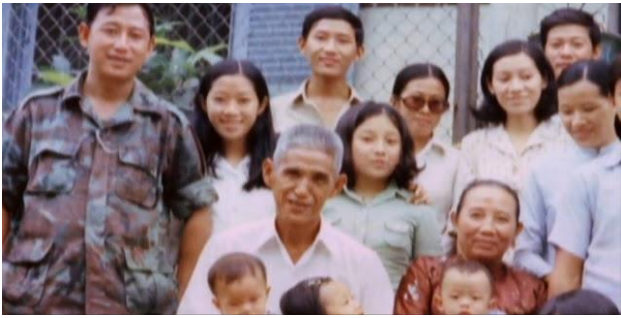
Đại gia đình chì Tùng trước năm 1975

Người xem phim được thấy cảnh của hòn đảo Bolinao, 17 năm sau khi được những ngư dân vớt... và một số “hoa đăng” đã được thả trôi ra biển như những vòng hoa riêng tặng những người đã yên nghỉ trong lòng đại dương. Và rồi câu chuyện thuyền nhân mang tên “Bolinao 52” bắt đầu.