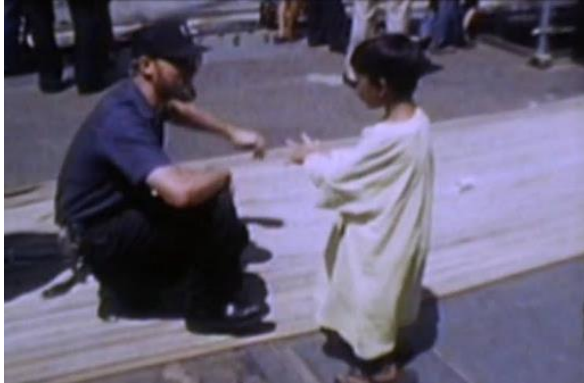
Trẻ em thuyền nhân và cựu hùng thủy thủ trên chiếc USS Long Beach

hiếp. Thuyền nhân Việt Nam có nhiều chuyện để kể lại nhưng cũng có nhiều chuyện quá bi thảm không thể nào nói ra và người ta thường yên lặng, dấu kín trong lòng.