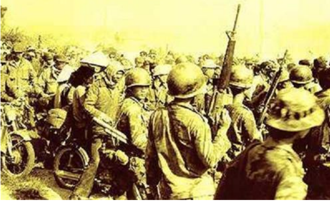
Quán dân Ban Mê Thuột trên đường di tản (3/75)

Cả Quân Khu II bị thất thủ kéo theo Quân Khu I và sau đó cả miền Nam Việt Nam. (Trách Nhiệm Làm Mất Miền Nam VN - Lữ Giang - Những Biến Cố Cần Được Ghi Lại do Hội HO Sacramento xuất bản năm 1996). Thiếu Tướng Phạm Văn Phú, Tư Lệnh chiến trường Quân Khu II và là cấp chỉ huy trực tiếp trách nhiệm cuộc triệt thoái bi thảm nhất trong 4 cuộc triệt thoái lịch sử trong chính thể Việt Nam Cộng Hòa.