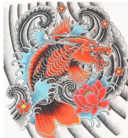
Tranh minh họa cá chép hóa rồng.

Lúc đầu, đàn cá chép rất hân hoan vui sướng vì cuối cùng chúng đã toại nguyện – đó quả là kỳ tích mà phải trải qua hàng ức vạn năm mới có thể xuất hiện một lần. Nhưng sau một thời gian, chúng nhìn nhau và tự hỏi: Rốt cuộc thì làm rồng và làm cá chép có gì khác nhau? Tất nhiên không con nào có thể trả lời được vì tất cả chúng đều giống y hệt như nhau. Thế là đàn cá chép lại cùng nhau gặp vua Thủy Tề để than vãn, rằng chúng phải nhọc sức vượt Long Môn để hóa rồng, vậy mà khi trở thành rồng rồi lại chẳng có gì thú vị hơn khi làm cá chép.