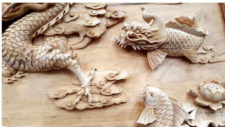
Tranh gỗ cá chép hóa rồng.

Câu chuyện về chú cá chép vượt Vũ Môn và được hóa rồng khiến cho tất cả những con cá chép khác trên sông Hoàng Hà ngày đêm cố gắng nỗ lực để vượt được Vũ Môn. Có những chú bị trầy vảy, tróc vẩy, có những chú bị chết, và có cả những chú cá vừa nhìn thấy liền bỏ cuộc.