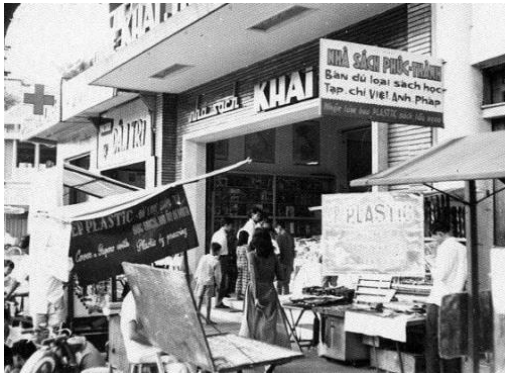
Nhà sách Khai Trí xưa.

Thời chúng tôi còn học trung học, tức dưới thời Tổng thống Ngô Đình Diệm, sách tiếng Việt ít nên muốn thi đậu bắt buộc phải dùng sách tiếng Pháp, như Toán hình học, Toán đại số, Toán vật lý... Học lớp Đệ tứ (lớp 9 bây giờ) mà làm hết cuốn Toán Hình học và Đại số của Réunion de Professeurs gồm 1.144 bài thì nhất, đi thi trung học chắc ăn như bấp.