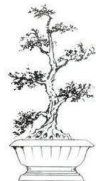
Thế cây Thất Hiền

Cây có 7 tầng (6 tàn ngang và một tàn ngọn) thân có thể trực thẳng nhưng uốn bẻ qua bẻ lại tả hữu theo chi âm chi dương của luật âm dương. Đoạn dưới cùng hơi cong qua bên phải (âm) cùng với cành và tàn lá hơi sà xuống mặt đất gọi là phủ địa (âm), đoạn thứ hai cong trả về bên trái (dương) với cành triều nhiên uốn hơi vươn lên một chút, đối xứng với cành phủ địa; đoạn thứ ba nghiêng sang bên phải (âm) với cành chiếu thủy (soi nước) và tàn lá hơi nhìn xuống như soi nước; đoạn thứ tư (dương) cong sang bên trái (dương) đỡ cành nghinh phong với dáng tàn lá phe phẩy như đón gió; đoạn thứ năm (âm) ngả sang bên phải trên điểm canh quán vũ (đón mưa); đoạn thứ sáu đón cành trung bình uốn nằm ngang, cân đối nhằm nối liền với các nhánh dưới và nối liền với ngọn, uốn hồi đầu trung để tôn trọng nguyên tắc gốc ngọn triều nguyên. Đây là Trúc Lâm Thất Hiền tu thành tiên, vào đời nhà Tấn : Nguyễn Tịch, Lê Khang, Hướng Tú, Lưu Linh, Sơn Đào, Nguyễn Hàm, Vương Nhung.