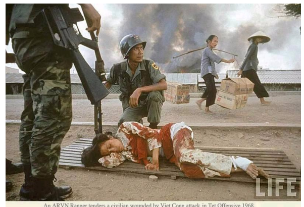
An ARVN Ranger tenders a civilian wounded by Viet Cong attack in Tet Offensive 1968.

Ngày nay, Người Cộng Sản ở quê hương với đôi tay dẫm máu của thuở nào cũng nói lời phản tỉnh. Vậy còn ta, bao nhiêu người Quốc Gia sẽ thức tỉnh để vẽ chân dung kỳ vĩ và nhiệm màu của Người Lính chúng ta. Có ai trong chúng ta sẵn sàng chi tiêu những bữa tiệc đắt tiền trong những nhà