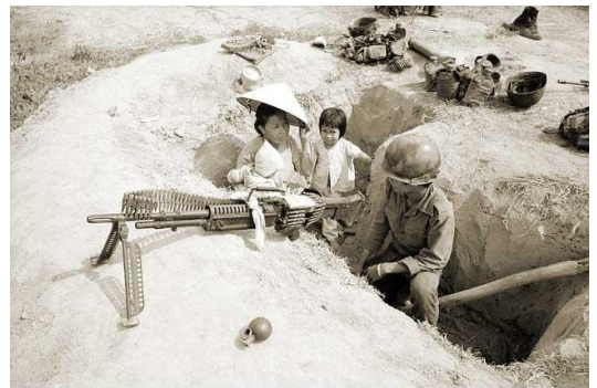
Family members visit an ARVN soldier at the trench

Người vợ lính cũng là những người hằng đêm thức muộn để lắng tai nghe tiếng đại bác thâu đêm, rồi định hướng với lo âu trần trọc.