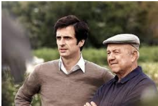
Gia đình Muls

Tại đây ngày nay có một khu vực trồng hoa riêng và một phân khu sản xuất nước hoa của Chanel. Hoa hồng và hoa nhài ở đây được đánh giá cao nhất về mùi hương và đây cũng là hai loài hoa chính được sử dụng trong quá trình sản xuất của Chanel. Để đảm bảo nguồn cung cấp hoa, Chanel chỉ làm việc với một gia đình trồng hoa duy nhất ở đây - gia đình nhà Muls. Họ phải thu hoạch từ 50-70 tấn hoa hồng (rosa centifolia) trong khi để có được 1kg cánh hoa cần tới 350 - 400 bông hoa.