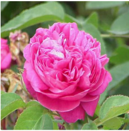
Hoa Rose de Mai $75 một bông