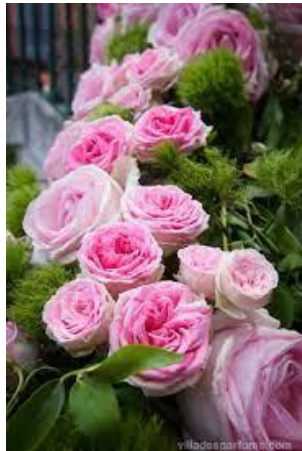
jasmine (bông lái)