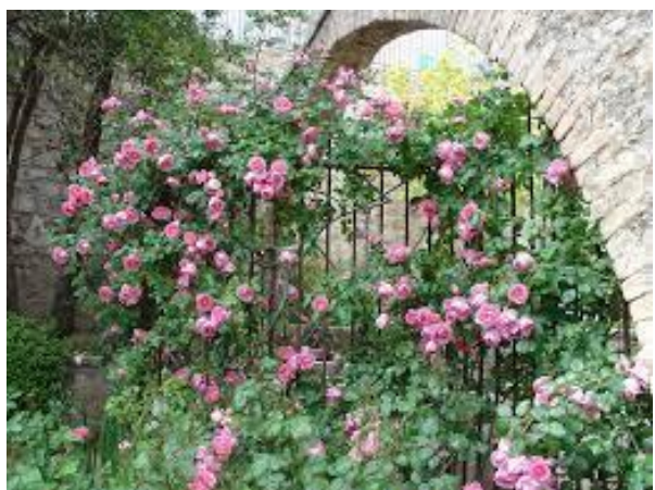
Roses de mai tại Grasse

Tại đây ngày nay có một khu vực trồng hoa riêng và một phân khu sản xuất nước hoa của Chanel. Hoa hồng và hoa nhài ở đây được đánh giá cao nhất về mùi hương và đây cũng là hai loài hoa chính được sử dụng trong quá trình sản xuất của Chanel. Để đảm bảo nguồn cung cấp hoa, Chanel chỉ làm việc với một gia đình trồng hoa duy nhất ở đây - gia đình nhà Muls. Họ phải thu hoạch từ 50-70 tấn hoa hồng (rosa centifolia) trong khi để có được 1kg cánh hoa cần tới 350 - 400 bông hoa.