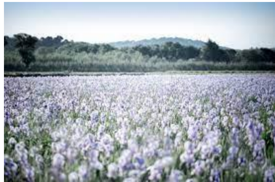
Ruộng hoa của nhà Muls

Những người thợ kinh nghiệm ở đây thường thu thập được đến 7kg cánh hoa một giờ. Số hoa này được chia ra để chế tạo các loại nước hoa khác nhau. Tuy nhiên những loại hoa chất lượng nhất sẽ để dành riêng cho Chanel N°5.