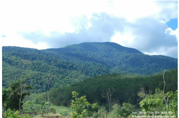
Đồi Charlie và khu dân-cư Sa-châu, được nhìn từ Sa-bình cách Sa-châu 9 cây số. Lối vào dễ-dàng nhất và gần nhất để đến Charlie.