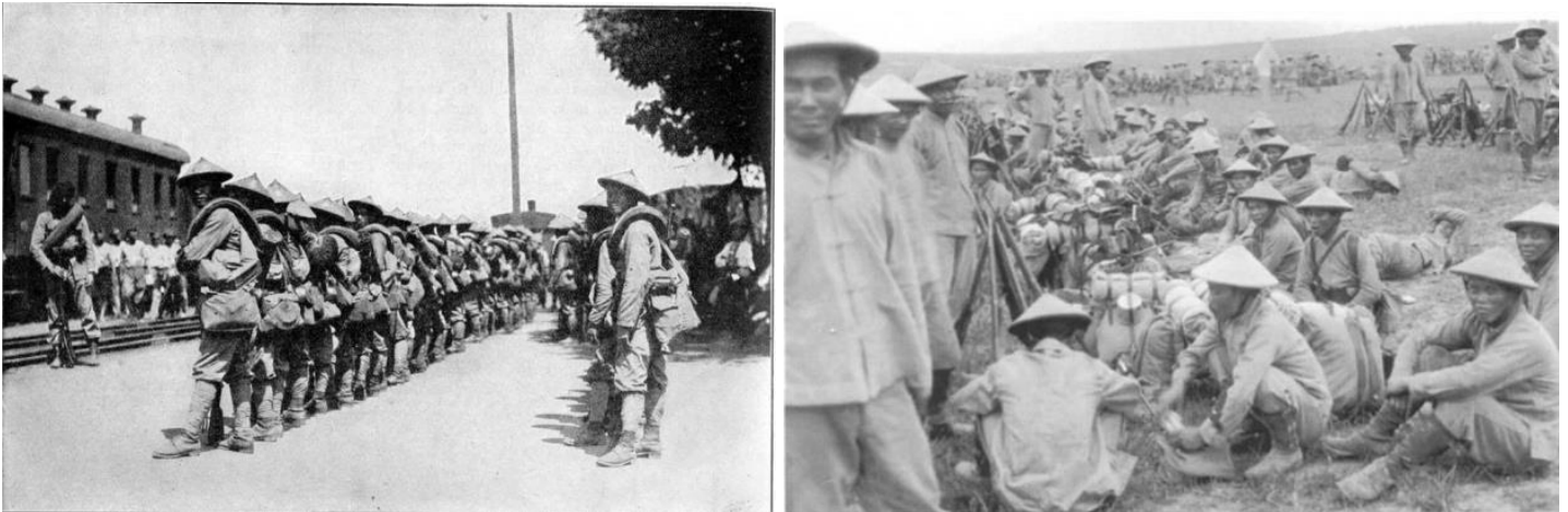
Lính An Nam (Vietnam) tại Saint-Raphael, đây là những người lính thiện chiến nhất trong chế độ bảo hộ Pháp

người Việt đầu tiên đặt chân lên đất Pháp để rồi từ đó ngang dọc Âu châu.