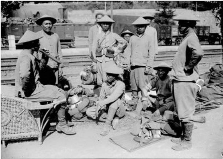
Một hình ảnh rất thuần Việt : hút thuốc Lào

Lính Mỹ hy sinh tại Âu châu cả đệ nhất và đệ nhị thế chiến với cả trăm ngàn quân. Hàng năm vẫn có các du khách Mỹ ghé đến tưởng niệm tại các nghĩa trang trên đất Pháp. Còn về phần người Việt, ngay cả trong sử của người xưa cũng không ghi nhận, nói chi đến việc ghé thăm.