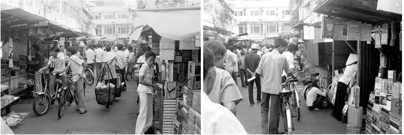
Đường Đặng Thị Nhu