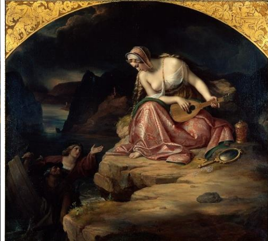
Nguồn: Lorelei, Gemälde von Carl Joseph Begas (1835)

So sánh với các giai thoại khác trên thế giới, liên quan đến tiếng hát, anh Trương Chi Việt Nam là người nhân hậu, không hãm hại bất cứ ai. Khác với sử thi Odyssey, đất Hy Lạp gần 3000 năm trước, Homer đã đề cập đến tiếng hát quyến rũ của các nàng tiên cá, với giọng hát du dương, quyến rũ bao nhiêu thủy thủ xa nhà, cô đơn giữa biển cả bao la, mất phương hướng, tàu bè đụng phải đá ngầm, mất mạng trên hoang đảo hay chìm sâu dưới đáy biển. Cũng theo khuôn mẫu hiểm nghèo đến từ phụ nữ, nước Đức có huyền thoại tương tự, có nàng Lorelei ngồi trên mỏm đá, bên bờ sông Rhein, xỏa tóc bờ vai, cất tiếng hát nồng nàn, động lòng bao chàng trai nhẹ dạ, chẳng khác chi mấy con thiêu thân, lái thuyền bè đâm sầm vào vách núi. Nước thánh.