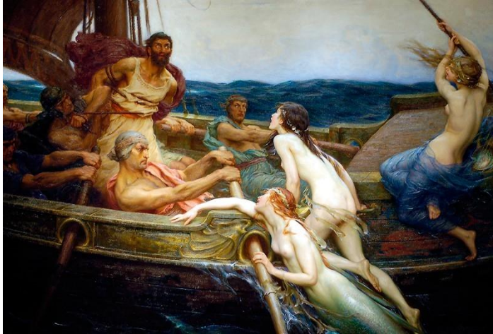
Nguồn: Ulysses and the Sirens by H.J. Draper

tiên sinh ra ông bà, ông bà sinh ra cha mẹ, cha mẹ sinh con cái, cháu chắt v... v... Cổ giải mã chuyện dòng sông Tiêu Tương, và quần quít theo đó, câu chuyện Trương Chi - My Nương, cũng không nằm ngoài quy luật phức tạp nói trên. Nên tôi xin tạm ngừng ở đây. Nhưng nói tóm lại dù chúng ta suy diễn thế nào đi chăng nữa, tiếng hát hay tiếng sáo Trương Chi, vang vọng trên dòng Tiêu Tương, rõ ràng không phải nhằm mê hoặc tha nhân; đó chỉ là lời tâm sự với trần gian, "một chiều xưa trắng nước chưa thành thơ" (Văn Cao). Anh Trương Chi có ngờ đâu, tiếng lòng trung thực giữa dòng đời của mình, lại dẫn đến một hậu quả bi đát cho chính bản thân.