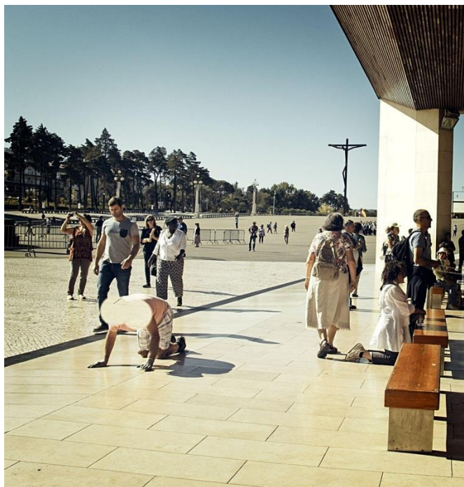
Người thì quỳ gối lết đi, người thì bò v... v... sao cho đủ mấy vòng quanh nhà nguyện Fatima.