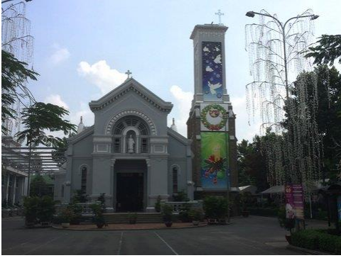
Nhà thờ Hạnh Thông Tây, Gò Vấp

nhưng được ông thuyết phục cũng đã miễn cưỡng đồng ý đến. Cô trang điểm nhẹ và mặc chiếc áo bình thường bằng lụa đen đến dự tiệc. Nhờ được học qua các lễ nghi, cô Lan đã đến trước mặt hoàng thượng và hành lễ. Vua chào lại. Cũng vừa lúc ấy điệu nhạc tango vang lên. Vua mời cô cùng nhảy. Mối quan hệ bắt đầu nảy nở từ đó cho đến năm 1934, Nguyễn Hữu Thị Lan trở thành Hoàng hậu Nam Phương.