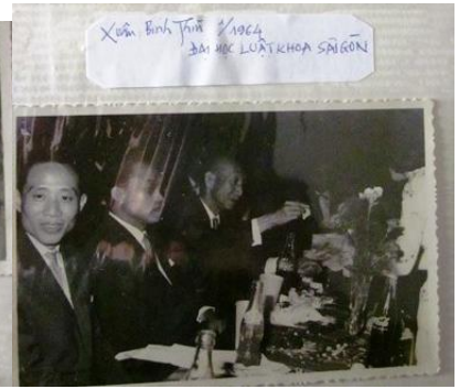
[1, 1b] Tác giả trong dạ hội tất niên ĐHLKSG và một số GS