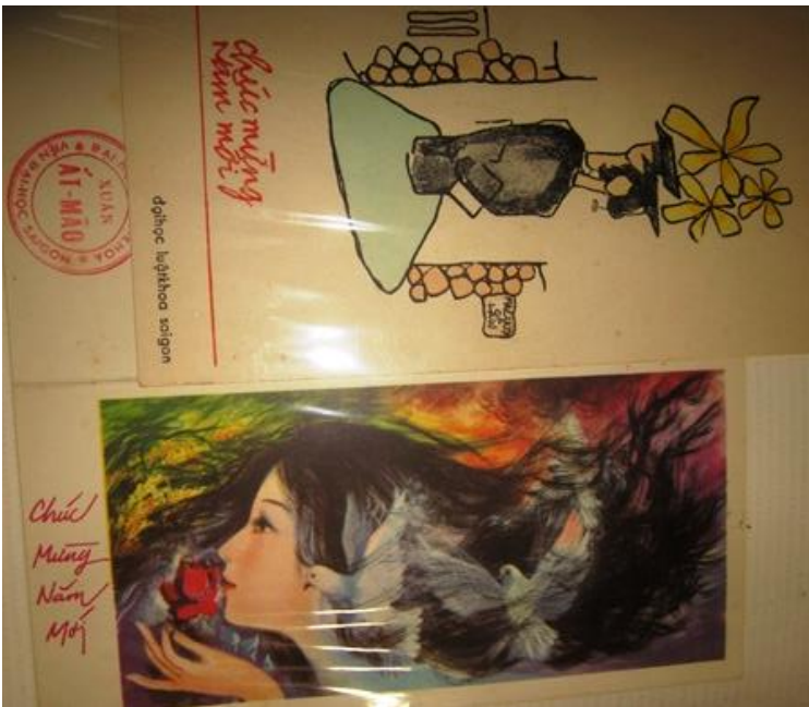
[2] Thiệp Tết trường ĐHLKSG