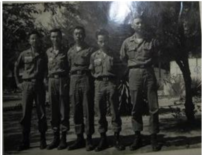
[4] Tác giả lúc ở quân trường VK Thủ Đức và khi trở thành SQ QC