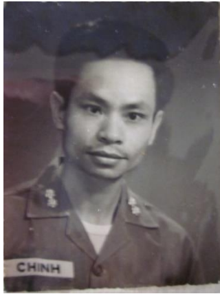
[5]. Trong lần công tác tại Ban Mê Thuột Khi là SQ QC [6]. (mặc quân phục chỉ để chụp ảnh kỉ niệm riêng)