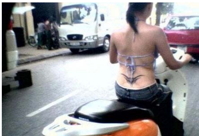
Áo thế này thì thà... đừng mặc cho xong

Phải công nhận là những cô gái diện những bộ đồ kiểu này thu hút sự chú ý thật! Ngoài đường nguyên nhân của một cơ số những vụ tai nạn giao thông có lẽ cũng là từ đây.