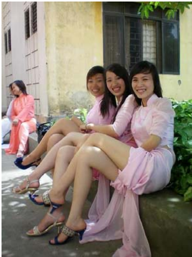
Thương quá... tà áo dài Việt Nam

Bản thân tôi cũng là con gái Việt, lúc đầu cũng hơi “tự ái” một tý, nhưng nghĩ lại thì phải công nhận điều đó. Một bộ phận không nhỏ trong số các bạn nữ hiện nay đang tự biến mình thành những cô gái tóc vàng hoe kém duyên, làm ảnh hưởng nghiêm trọng đến hình ảnh con gái Việt Nam.