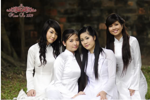
Còn đâu những nữ sinh dịu dàng, trong sáng?

Có nhiều cô đúng là trở thành “hot girl” sau màn “phơi da thịt” trên mạng. Ừ thì cũng “nổi tiếng” hơn, được nhiều người “biết đến” hơn. Nhưng hình ảnh mà người ta biết đến đấy chỉ là cái mác nổi loạn, thiếu văn hoá, tế nhị tối thiểu của một người con gái. “Được biết đến” ấy cũng chỉ là những lời trêu ghẹo, ong bướm của những tay chơi và sự bàn tán, xì xầm của mọi người xung quanh. “Đổi chắc” chính hình ảnh và sự yêu mến của mọi người để lấy cái danh hào “hot girl” và danh thực “hư hồng” có đáng không?