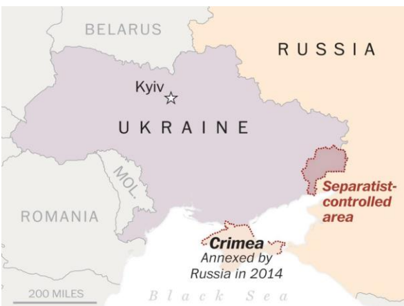
Bản đồ Ukraine – Nga.

Các sự kiện này xảy ra sau khi phong trào biểu tình Euromaidan tại Ukraine lật đổ chính phủ thân Nga của tổng thống Viktor Yanukovich vào tháng 2/2014. Nga xem sự kiện này là một “cuộc đảo chính” (coup d’etat) được phương Tây bảo trợ, và gọi chính quyền mới của Ukraine là một “nhóm quân phát xít” (fascist junta).