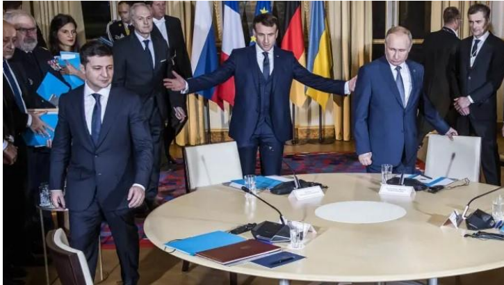
Một cuộc đàm phán giữa Nga và Ukraine do Pháp và Đức chủ trì tại Điện Elysee (Paris) vào tháng 12/2019.

Việc một số nhóm quân sự cực hữu (far right) tham gia vào lực lượng quân chính phủ trong cuộc nội chiến ở Ukraine tạo lý do cho Nga gọi đây là “đội quân phát xít”. Tuy nhiên, không có bằng chứng cho thấy chính quyền của Ukraine là một chính quyền cực hữu hay phát xít. Trong cuộc bầu cử vào năm 2019, liên minh chính trị của các nhóm cực hữu chỉ nhận được 2% phiếu bầu.] Mặt khác, tổng thống hiện thời của Ukraine, Volodymyr Zelensky, là một người gốc Do Thái (Jewish). Người thân của ông là nạn nhân và từng chiến đấu chống lại quân phát xít Đức.