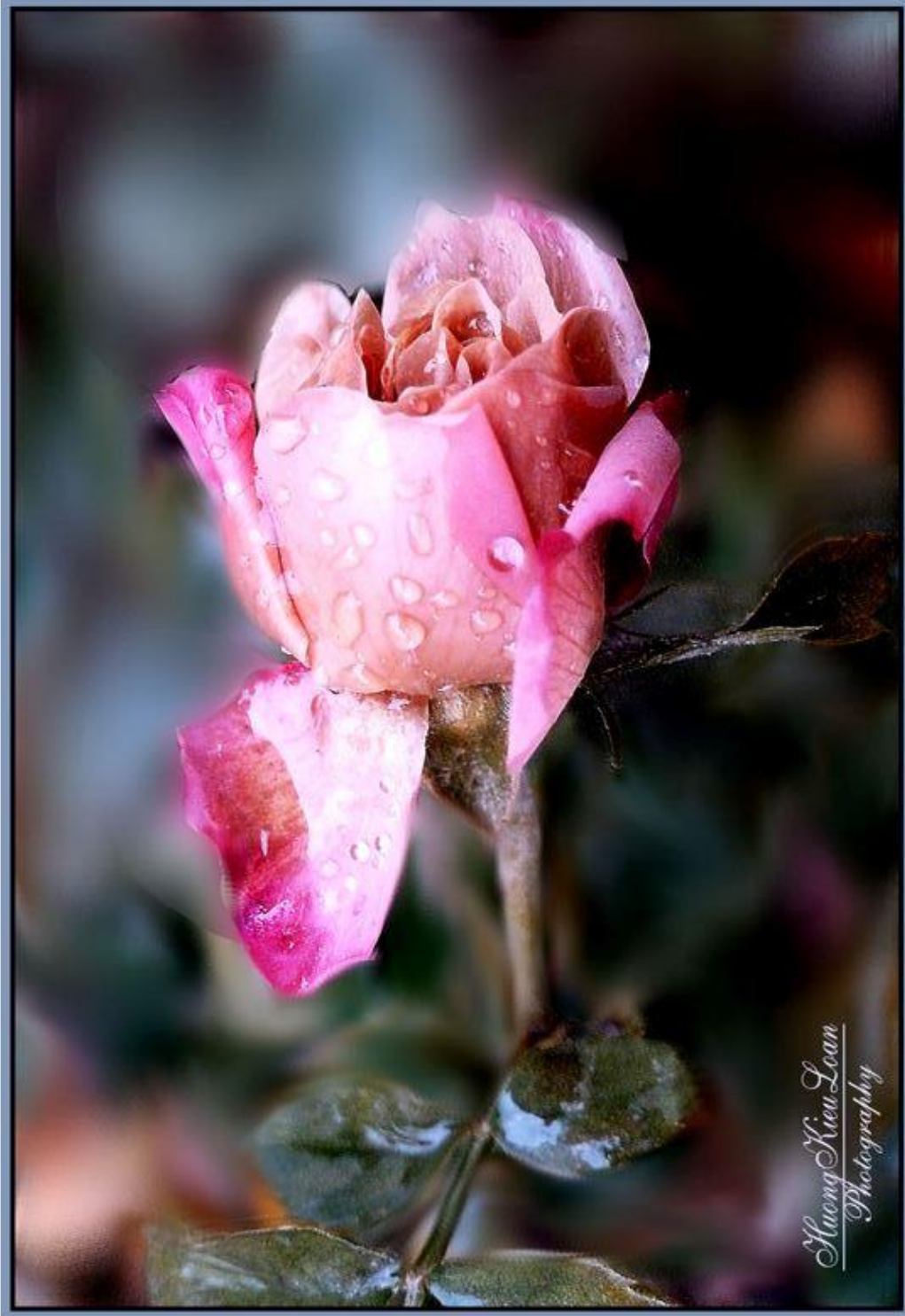
Bông hoa này từ cây hồng khôn khổ vì nhiệt độ -10 F-- ở trên