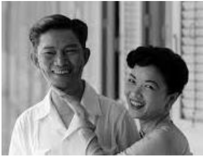
Ngô Đình Nhu và Vợ

nhưng ông dứt khoát từ chối. Mà sáu ngày sau (27-03-55) ông còn cho lệnh đại tá Đỗ cao Trí đánh chiếm bộ chỉ huy Công an Cảnh sát do BX nắm giữ. Thế là chiến tranh giữa thủ tướng Ngô đình Diệm có quân lực Quốc gia ủng hộ và BX có Pháp hậu thuẫn đã khởi sự và hai bên có cả một tháng để chuẩn bị đánh lớn, cũng gọi là hưu chiến.