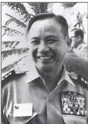
Tướng Nguyễn Văn Võ

Ở đây cũng nên nhắc lại những biến cố rất quan trọng sau đây, nhưng tôi kể là bên lề vì nó không có tính cách quyết định, nó như là mây màn của một tấn bi hài kịch lịch sử mà các diễn viên, từ những tên lưu manh hạng nặng, những nhà ngoại giao ngu ngơ, cho đến những chánh trị gia lỗi lạc phi thường, những anh hùng rất thông minh và can trường... mà vai nào cũng đặc sắc cả, đặc sắc ở đây không có nghĩa là vai trò nào cũng tốt đẹp đáng vỗ tay.