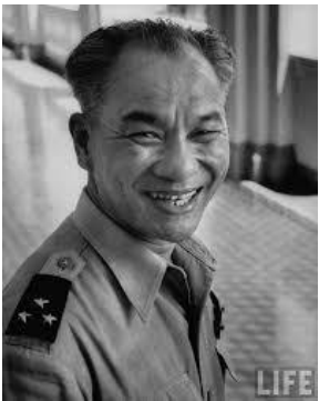
Tướng Lê Văn Ty

Nhưng với sự hợp tác chặt chẽ giữa CIA và tòa Đại sứ Mỹ, Thủ tướng Ngô đình Diệm giải quyết được cuộc khủng hoảng do tướng Nguyễn Văn Hinh gây ra, nhưng không phải là không đổ mồ hôi: đại sứ Heath cho tướng Hinh biết là nếu có đảo chánh trong tình thế này thì Mỹ sẽ cúp viện trợ quân sự ngay, đang khi đại tá Lansdale tìm cách tách tướng Hinh ra khỏi tham mưu của ông ta là 2 nhơn viên phòng nhì của Pháp, Lansdale biểu hai sĩ quan này hai vé máy bay đi Manila du hí năm ngày.