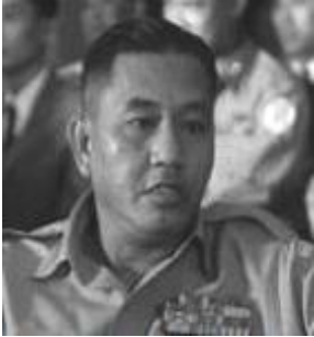
Dương Văn Minh

Chuyện thứ hai là chuyện của một ông đặc sứ Collins của TT Eisenhower. Sau khi không chinh phục được Thủ tướng Diệm theo đề nghị ngu ngơ cải tổ chánh phủ của mình, ông tự cho mình bị khinh bạc, mất mặt với bạn bè chi binh, biết đâu lại không có miệng lưỡi của một mụ đàn bà xúi bậy vào... ông vội bỏ VN trở về Mỹ chính hai ngày trước khi BX khởi chiến. Ông về Mỹ ráo riết vận động với Quốc hội, với bộ Ngoại giao, với hội đồng An ninh Quốc gia và triệt để khai thác tình tự bạn chi binh với chính TT Eisenhower. Sau 5 ngày vận động không ngừng nghỉ, ông thành công: TT Eisenhower gửi tối hậu thư tuyên bố "Diệm must go" để ông Đặc sứ mang về Sài Gòn, phổ biến cho các đảng phái liên hệ, cũng có thể như là món quà đáng giá triệu đô cho bạn chi binh của ông là tướng Ely và nhứt là cho Bảy Viễn.