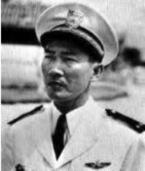
Tướng Nguyễn Văn Hinh

mà không có quân đội, bộ Nội vụ không có Công an Cảnh sát, trong lúc đô thành Sài Gòn - Chợ lớn là Bình xuyên, miền Tây Nam kỳ lục tỉnh là Hòa hảo, miền Đông là Cao đài, quần chúng người Nam nghe nói đến Ngô đình Diệm, nhưng không biết Ngô đình Diệm là ai. Ngoài ra sau lưng tướng Ely, Cao ủy Pháp là cả một tập đoàn thực dân đang hôi quyền thế, hôi cả tài sản như buổi chợ chiều. Trong lúc người Mỹ mới nhảy vào chánh trường VN chưa có một chủ trương rõ ràng... Tất một lời, xã hội miền Nam đang ở trong một tình trạng vô cùng hỗn mang gần như tuyệt vọng, vô phương cứu vãn. Dự luận Quốc tế cho chánh phủ Ngô đình Diệm không thọ quá 6 tháng.