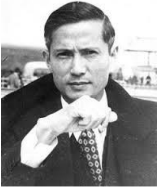
Phan Huy Quát

hồ giựt dây. Thế là lại khủng hoảng! Collins còn cực đoan hơn nữa. là đề nghị với Washington: Nên đưa Bảo Đại về, đem Phan Huy Quát lên làm thủ tướng thay thế Ngô đình Diệm và ban hành tình trạng khẩn trương, tập hợp các lực lượng quốc gia để thống nhất hành động. Nếu không thực hiện giải pháp này được, thì tốt hơn Mỹ nên rút ra khỏi VN.