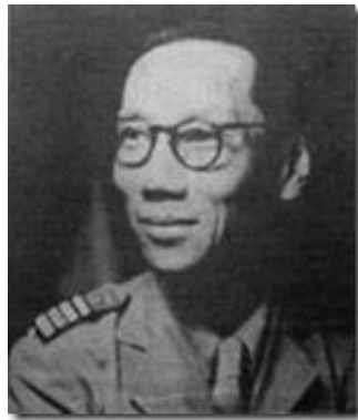
Vua Duy Tân (ở giữa) và các bạn. Thiếu tá Vĩnh San.

Rồi chuyển qua ngành khác và được thăng chức lên tới thiếu tá. Ngày 14 tháng 12 năm 1945, Charles de Gaulle tiếp cựu hoàng Duy Tân. Trong tập Hồi ký chiến tranh, tướng de Gaulle ghi: