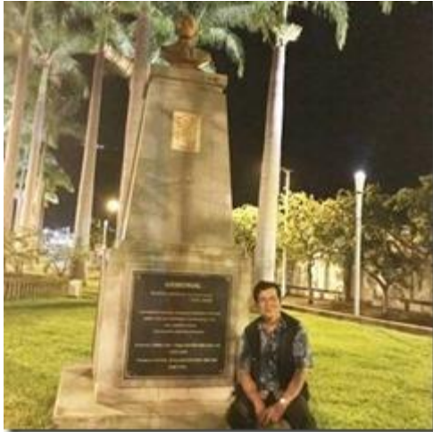
Đài Tưởng Niệm Vua Thành Thái và Duy Tân tại Đảo La Réunion vào lúc nửa đêm.

Đảo Réunion là một trong những nơi chính chúng tôi muốn viếng thăm trong chuyến du hành qua các đảo vùng Ấn Độ Dương nằm sát cạnh châu Phi như Seychelles, Madagascar, Mauritius vì đảo đã từng có dấu chân lưu đày của hai vị vua Việt Nam là Thành Thái và Duy Tân.