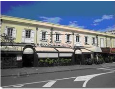
Tiệm Ăn Le Roland Garros (ảnh của tác giả).

Cũng may là đêm nay tàu ngủ qua đêm ở đảo này nên không sợ nhớ tàu. Titi rất thông minh biết là chúng tôi đang lo nên đã điện thoại nhờ cô bạn nha sĩ người Pháp làm tại Saint Denis đến gặp chúng tôi để trấn an. Hơn tám giờ Titi mới tới. Chúng tôi quyết định đi ăn tối trước rồi mới đi thăm các nơi vinh danh Thái Tử Vĩnh San ở đây. Vì ăn mãi đồ ăn Tây phương trên tàu đã chán ứ tới cổ, thêm món ăn Việt Nam nên dự định tới một tiệm ăn Việt Nam nổi tiếng nhất ở đây là tiệm Kim Sơn. Rủi thay nhà hàng đóng cửa hôm ấy. Cuối cùng chúng tôi quyết định tới tiệm ăn Nhật Shabu Shabu. Khi vào tiệm mới biết chủ là người