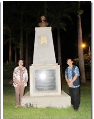
Tượng đài nằm ở một công viên cây cao bóng cả với những cây kè hoàng gia cao rất đẹp.