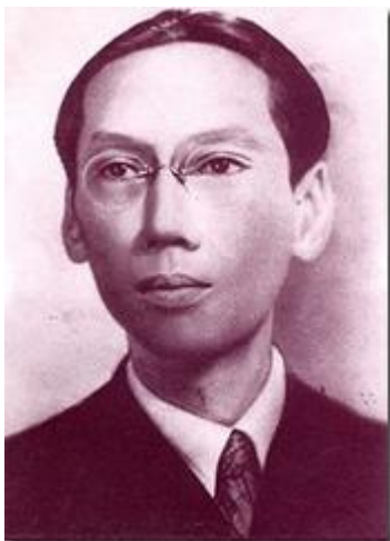
Vua Duy Tân năm 1930.

Ngày 28 tháng 3 năm 1987, hài cốt vua Duy Tân được gia đình đưa từ M'Baiki, Trung Phi về Paris làm lễ cầu siêu tại Viện Quốc tế Phật học Vincennes và sau đó đưa về an táng tại An Lăng, Huế cạnh nơi an nghỉ của vua cha Thành Thái, vào ngày 6 tháng 4 năm 1987.