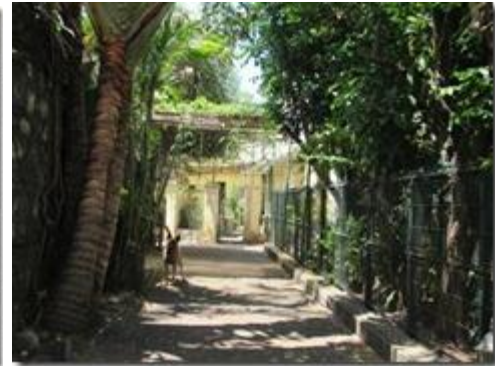
Buổi trưa ghé ăn trưa ở một nhà hàng ăn Việt Nam nổi tiếng nhất ở đây: Tiệm Ăn Kim Sơn mà hôm qua chúng tôi muốn mời Titi ăn tối nhưng nhà hàng đóng cửa.