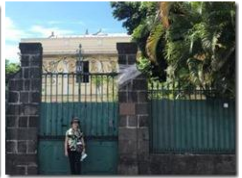
Hình ngôi nhà cũ, chụp ngày xưa. Một người bạn cho địa chỉ ở Đại Lộ La Bourdonnais.