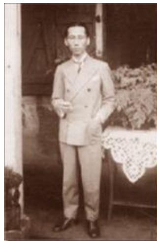
Thái tử Nguyễn Phúc Vĩnh San, chụp ảnh tại nhà ở St-Denis, La Réunion ( http://www.historicvietnam.com ).

Ông học vô tuyến điện và mở tiệm Radio-Laboratoire bán và sửa chữa máy thu thanh. Đồng thời, ông học tú tài ở trường trung học Leconte de Lisle và học thêm ngoại ngữ, luật học. Ông yêu nhạc, cưỡi ngựa giỏi và viết nhiều thơ văn đăng trong những tờ báo Le Peuple (Dân chúng), Le Progrès (Tiến bộ) dưới biệt hiệu Georges