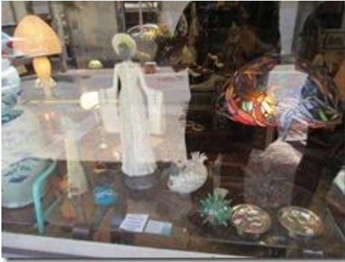
Tượng phụ nữ Việt đội khăn vành dây mặc áo dài thời trang tay áo thụng tế cảm quạt có hình dạng quạt mo.

Ăn xong chúng tôi ghé Chợ Trung Ương ở ngay bên kia đường. Chợ có đầy đủ các thứ cho du khách mua làm quà kỷ niệm. Tuy nhiên giá sinh hoạt ở đây rất đắt đỏ so với các đảo lân cận nhất là so với Madagascar vì mọi thứ ở đây hầu như đều phải mang từ Pháp qua. Các cửa hàng ở đường phố cũng thấy có bán hàng mỹ nghệ Việt Nam.