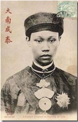
Vua Thành Thái của Đại Nam