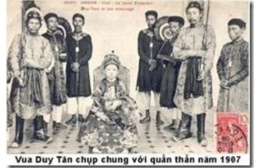
Vua Duy Tân chụp chung với quần thần năm 1907

Vua Duy Tân sinh ngày 19 tháng 9-1900 chết ngày 26 tháng 12-1945 nữ danh là Nguyễn Phúc Vĩnh San , vị vua thứ 11 của Nhà Nguyễn. Khi vua cha bị ép thoái vị, Khâm sứ Pháp Fernand Ernest Lévecque vào hoàng cung chọn người kế vị. Lúc điểm danh các con của vua Thành Thái thì thiếu mất thái tử Vĩnh San. Ông đang ở dưới gầm giường khi bị lôi ra mặt mày lem luốc. Bị tra hỏi thì thái tử Vĩnh San nói "Ta đang tìm con để vừa mới xong" . Vị Khâm Sứ thấy Vĩnh San chỉ mới có 7 tuổi, nhút nhát, thơ dại nên dễ uốn nắn và kiểm soát hơn là chọn những người anh lớn do đó chọn Vĩnh San đưa lên làm vua. Triều đình lấy tên hiệu cho vua là Duy Tân, có ý muốn vua tiếp nối con đường duy tân không thành của vua cha Thành Thái. Vị Khâm Sứ Pháp đã làm, Vua Duy Tân có thái độ chống Pháp còn quyết liệt hơn.