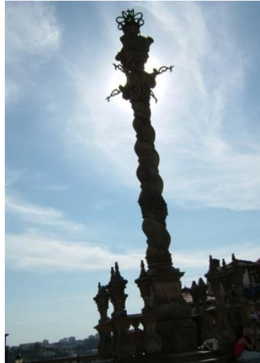
Thánh đường - Sé