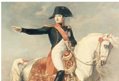
Napoléon Đại Đế

Ngày 9/11/1799 tại Paris, ông đã thiết lập một chính thể mới, Quốc hội với một Hội đồng tư vấn Bonaparte đầu tiên, sau này vào năm 1802 và 1804 được cải tổ lại để thành lập triều đại Napoléon Bonaparte.