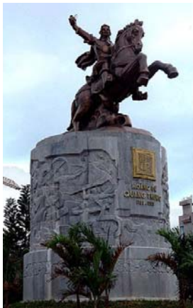
Quang Trung Đại Đế

Được tin Nguyễn Huệ vội vào Gia Định, áp dụng chiến thuật lùi để nhử địch vào các địa điểm chiến lược. Tại Xoài Mút, Nguyễn Huệ đặt phục binh bên Rạch Gầm nay thuộc tỉnh Định Tường, quân Xiêm đến, quân của Nguyễn Huệ đổ ra đánh bất thành linh, đánh cả hai mặt thủy bộ, chặn đường rút lui của địch. Quân Xiêm xoay trở không kịp, chết và bị thương rất nhiều, mười phần chỉ còn một, hai, manh đầu chạy về nước.