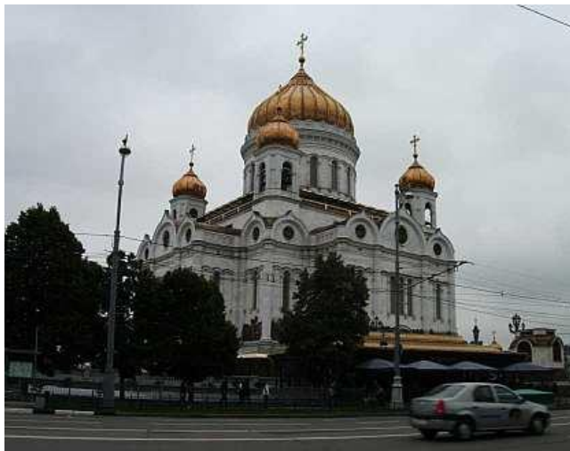
Christ The Savior

Nhà thờ Christ the Savior được hoàng đế Alexander I cho xây bắt đầu từ năm 1812 sau khi đạo quân của Napoleon rút khỏi Matxcơva. Trải qua nhiều biến cố và nhiều thay đổi cho đến năm 1883 nhà thờ được chính thức công nhận trong buổi đăng quang của Alexander III ngày 26 tháng 5, 1883. Một năm trước đó, bản hòa tấu bất hủ 1812 Overture của Tchaikovsky được trình diễn lần đầu tiên ở đó. Thánh đường bị phá hủy hoàn toàn vào cuối năm 1931 theo lệnh của Stalin. Nhà thờ được chính thức cho phép xây lại vào đầu năm 1990. Nhà thờ được xem như đã hoàn tất vào mười năm sau, vào tháng tám năm 2000. Sự trở lại của biểu tượng chiến thắng của liên bang Nga này được cho là chủ yếu nhờ công của Yury Luzhkov, thị trưởng thành phố Moscow từ năm 1992 cho đến mùa thu 2010.