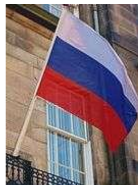
Biểu tượng Triều đại Nga cổ xưa Biểu tượng Liên bang Nga. Cờ Liên bang Nga