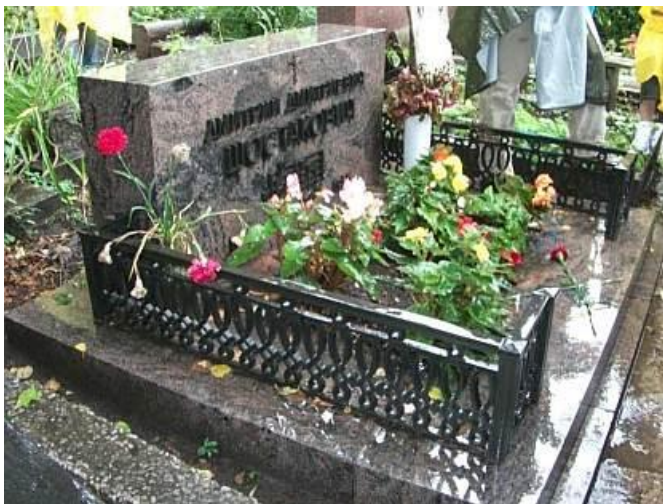
Mộ Shostakovich với mô hình D-Eb-C-B của ông

Sau khi thăm Viện bảo tàng Tretyakov-Mới, nơi trữ những tác phẩm đẹp và tiêu biểu nhất của Mỹ thuật Tạo hình Xô-Viết (1917-1991) như đã nhắc đến trong phần I của bài viết, đoàn được đưa đi thăm Nghĩa trang nằm trong Tu viện cổ Novodevitchy (Nobodevichy cemetery), nơi an nghỉ của các nhà hoạt động chính trị, các triết gia và văn nghệ sĩ nổi tiếng. Nhiều sách du lịch viết về những nghĩa trang nổi tiếng của một thành phố, và nhiều tour du lịch đã bao gồm cả thăm viếng nghĩa trang vào lộ trình. Thí dụ khi đi Paris thì có nghĩa trang Montparnasse và Père La Chaise, và đi Moscow thì ghé thăm nghĩa trang tại tu viện Novodevichy.