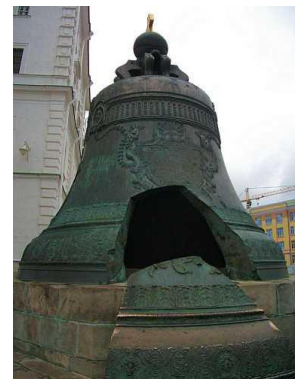
Dormition Cathedral Tháp chuông Ivan The Great Chuông Sa hoàng