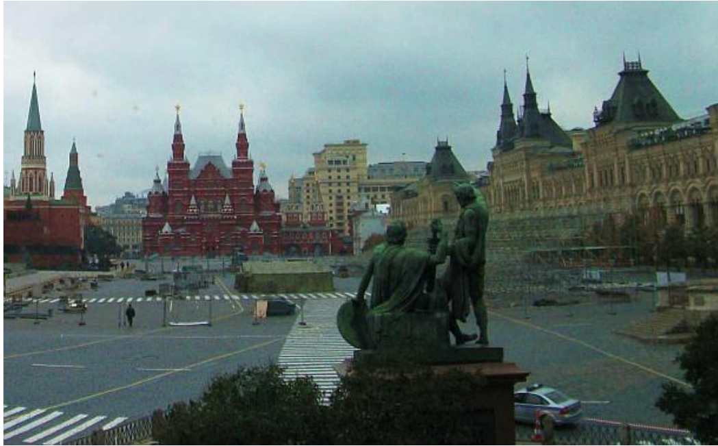
Quảng trường Đỏ chụp từ nhà thờ Thánh Basil từ tượng đài Minin & Pozharsky có thương xá Gum bên phải

Nếu đứng từ phía bắc từ Resurrection Gate cạnh State History Museum chụp xuống phía nam của Quảng trường đỏ Red Square thì thấy Nhà thờ St Basil ở đằng xa phía bên trái. Chữ "đỏ" của Quảng trường Đỏ không phải tượng trưng cho cộng sản hay ngay cả bức tường màu đỏ chung quanh quảng trường, mà chỉ có ý muốn nói về St Basil. Chữ Nga krasnaya có nghĩa là đẹp và cũng có nghĩa là đỏ, do đó từ ý nghĩa đẹp ám chỉ nhà thờ đã dần dần bị biến chuyển thành một địa danh mang tên Red Square.