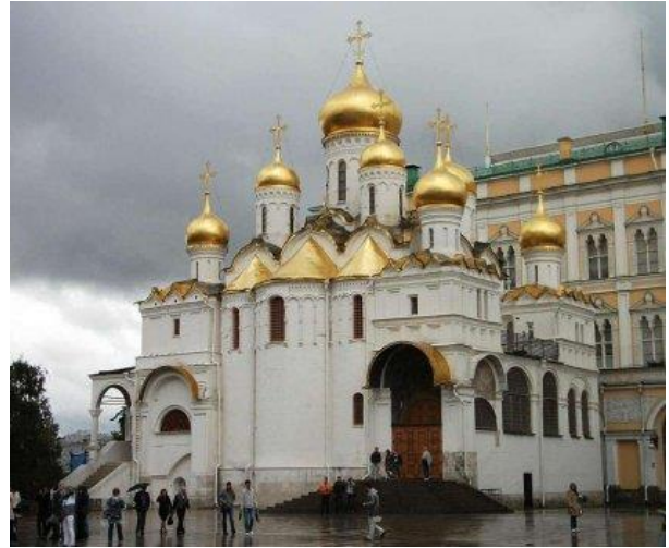
Cathedral of The Annunciation