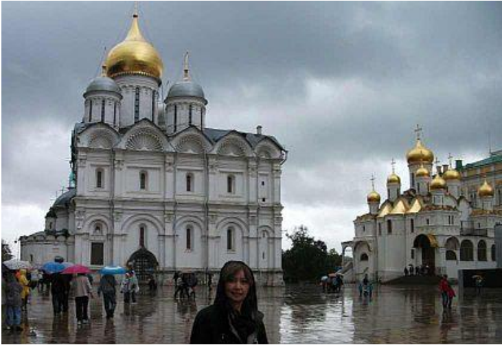
The Archangel Michael Cathedral

sau đó là của các đại diện giáo chủ. Trong thành cổ Kremlin có nhiều thánh đường và dinh thự xây cất từ thế kỷ 15 đến 20 và được phân chia thành nhiều quảng trường. Đáng kể nhất là hai quảng trường Sobornaya (Cathedral) và Ivanovskaya. Và trong Kremlin cũng có Viện bảo tàng Orujeinaia Palata, nơi trưng bày kho tàng vô giá của các triều đại Sa Hoàng.