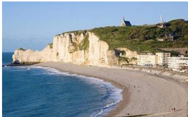
Vách đá vòm Amont (*)