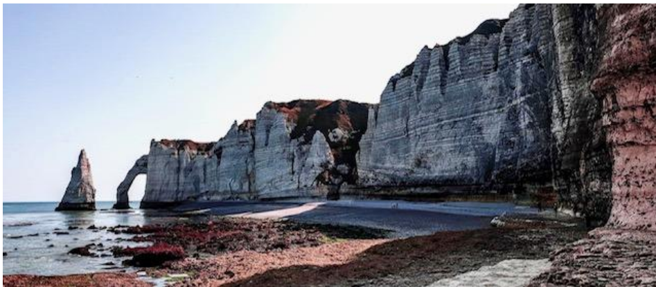
Aiguille & Aval.

Cấu trúc tạo hình của "những vách đá cao bị xoi mòn trở thành những vòm kỳ lạ này được gọi là Cổng" (Maupassant, Adieu, 1884) đã tạo cho nơi này một cảnh quan khác thường. Manneporte, vòm hờ lớn nhất trong số ba vòm hờ trong vách đá, là "một vòm hầm khổng lồ mà một chiếc tàu nhỏ có thể đi xuyên qua được" (Maupassant, Guillemot Rock, 1882).