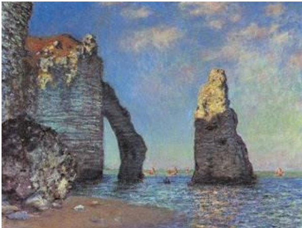
Aval và Aiguille (*)

Claude Monet vẽ The Manneporte (Etretat) vào năm 1883. Manneporte, một vòm tự nhiên khổng lồ nhô ra biển trên bãi biển Etretat, đã thu hút sự chú ý của Monet trong thời gian ông ở Bờ biển vào những tháng đầu năm 1883. Monet đã dành phần lớn thời gian của tháng 2 năm 1883 tại Étretat, một làng chài và khu nghỉ mát trên bờ biển Normandy. Ông đã vẽ hai mươi quang cảnh bãi biển và ba vách đá đặc biệt trong khu vực: Aval, Amont và Manneporte.