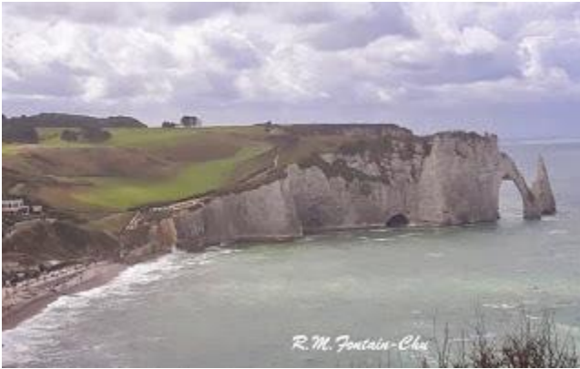
Vòm Aval và Aiguille