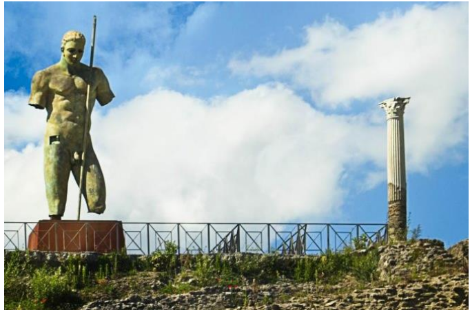
Icarus gãy cánh nằm trước đền "Temple of Concordia" tại Valley of the Temples, Agrigento, Sicily, Nam Ý. Tượng Daedalus ở Pompeii, Nam Ý

Igor Mitoraj, nhà tạc tượng đương đại, cha gốc Pháp, mẹ Ba Lan, chôn nhau cắt rốn tại Đức năm 1944, là tác giả 2 bức tượng nói trên. Ông tốt nghiệp ngành Hội họa tại Viện Nghệ thuật Krakow, Ba Lan (1967). Sau khi chuyển sang sống ở Paris, Igor Mitoraj có dịp du hành một số quốc gia vùng Nam Mỹ. Thông qua những chuyến đi đầy cảm xúc, ông ta bị quyến rũ bởi vẻ đẹp kỳ diệu thoát ra từ các pho tượng mang sắc thái đặc biệt chỉ có thể xuất hiện ở Châu Mỹ La Tinh. Như một cậu bé dậy thì chợt tìm thấy tình yêu, Igor Mitoraj bỏ hẳn hội họa để quay sang điêu khắc (1974). Và nhà tạc tượng Igor Mitoraj lại tiếp tục tiến hành nhiều chuyến đi khám phá nghệ thuật, lần này các điểm hành hương là nước Ý, nơi còn rất nhiều tác phẩm điêu khắc cổ đại còn tồn tại đến hôm nay, nhưng đã bị dấu ấn thời gian bào mòn hay gây tổn thương nghiêm trọng. Cho đến 2014, năm ông ta từ giả cõi đời, các tác phẩm điêu khắc của Igor Mitoraj luôn xoay quanh chủ đề "trân trọng những gì cổ kính, từ đó khám phá và phát triển cái đẹp trong sự đổ vỡ, không toàn vẹn". Sử dụng vật liệu đá, đất sét, hay đồng thau, những đứa con tinh thần của ông ta (nằm rải rác khắp nơi trên thế giới, kể cả tại La Défence, ngoại ô Paris) chỉ là một phần nào đó của thân thể, khiến chúng ta khi ngắm nhìn, vừa liên tưởng đến các bức tượng cổ xưa bị tàn phá theo thời gian, vừa phải đắn đo về nỗi đau mất mát của con người.