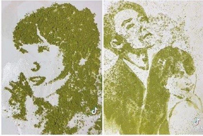
Cư dân mạng VN dùng trà xanh để vẽ ba nhân vật trong câu chuyện “trà xanh” dưới đây

Chuyện “trà xanh” này xoay quanh cuộc tình 8 năm của một cặp ca sĩ trẻ (được cho là) đã tan rã bởi một cô gái mới, cô gái đó bị người ta gọi là “trà xanh”. Và “trà xanh” ở đây được cộng đồng mạng Việt “lạm” từ “ngôn tình” của Tàu Cộng, không phải nói về lá trà mà để nói những người con gái ngoại hình xinh xắn, dịu dàng nhưng bản tính xấu xa, luôn có hứng thú với bồ/chồng người khác, những “hoa đã có chủ”.