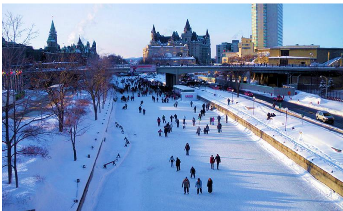
Kênh Rideau - Sân trượt băng lớn nhất thế giới vào mùa đông

Một thú vui không thể bỏ qua vào mùa đông tại Ottawa, đó là đi trượt băng trên kênh Rideau, một phần của di sản thế giới được Unesco công nhận, là hệ thống kênh đào lâu đời nhất vẫn còn hoạt động tại Bắc Mỹ. Vào mùa đông, sau khi đóng băng thì kênh này sẽ biến thành sân trượt băng lớn nhất thế giới, trải dài đến 202 mét, hoàn toàn miễn phí, thu hút biết bao khách địa phương và du khách khắp nơi đổ dồn về đây trong mùa lễ hội. Chưa kể là vào mùa hè, du khách còn có thể đến đây đi chơi trên kênh bằng ca nô, đạp pédalo, hay chèo xuồng.