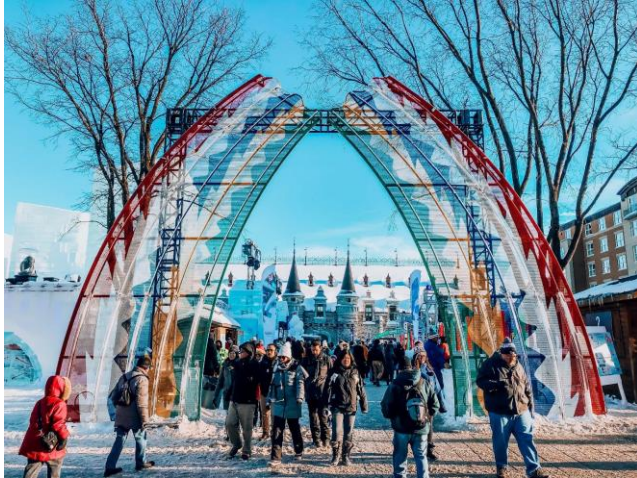
Lễ hội Giáng Sinh tại Québec

Nếu Québec được xếp vào một trong những thành phố được yêu thích nhất trên thế giới để đón Giáng sinh thì đó cũng không phải là sự ngẫu nhiên. Québec, với lối kiến trúc mang nặng sắc thái Âu Châu, những căn nhà cổ kính phủ đầy tuyết trắng, tạo nên một không gian thần thoại vào dịp lễ này. Du khách đến thăm tỉnh Québec, thì thành phố Québec, thủ đô của tỉnh này, là điểm dừng chân đầu tiên vì sự tráng lệ, lịch thiệp, một viên ngọc về mặt kiến trúc và lịch sử, một cái nôi của nền văn hóa Pháp tại Canada. Đây là nơi chúng ta tìm thấy Quốc hội Québec, vì thành phố này chính là thủ đô hành chính và chính trị của tỉnh Québec, và cũng có thể coi là thủ đô kinh tế, vì đó là một trong những thành phố năng động nhất ở Canada, sau Calgary, Edmonton và Saskatoon. Tuy nhiên, về diện tích thì thành phố Québec vẫn nhỏ hơn Montréal.