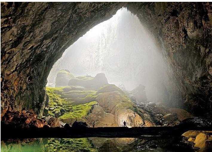
Hang động Sơn-Đòng lớn nhất thế giới

Thêm vào đó, lấy thí dụ như hiện nay phương tiện vật chất đi về thăm quê hương đối với hầu hết mọi thành phần trong cộng đồng người VN ở nước ngoài tương đối không còn được coi như là một trở ngại chính yếu. Vậy thì, thay vì theo thói quen để cho con em đi nghỉ hè hàng năm tốn kém cũng nhiều. Còn bây giờ, thì chúng có thể thu xếp chương trình lại, để tìm dịp về thăm quê cha mẹ, nói năng tiếng Việt khi kính viếng thân tình bà con trong làng mạc, phố phường, tham quan các thắng cảnh quê hương. Và nhất là, về hình ảnh của các di tích cơ sở văn hóa cung đình tư tưởng của tiền nhân ít nhất cũng một vài lần. Mục đích đó là nhằm để cho chúng tìm cơ hội mục kích với cái nhìn cụ thể mà sẽ có được những nhận thức với lối suy tư khoa học thời đại, và thận trọng đánh giá đúng đắn rõ ràng về màu sắc của đất nước tổ tiên. Hơn thế nữa, nếu cần chúng cũng phải còn dành thêm rất nhiều thì giờ để nghiên cứu, đào sâu các công trình sử liệu về nguồn cội giống nòi trải qua những chứng tích cổ xưa của bao triều tiên đế từng đã làm vẻ vang niềm tự hào tinh thần dân tộc.