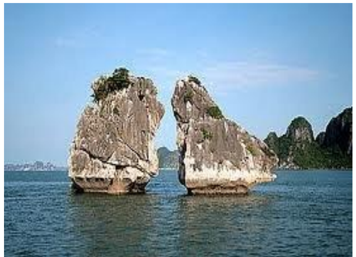
Hòn Trống Mái biểu tượng cho Vịnh Hạ-Long