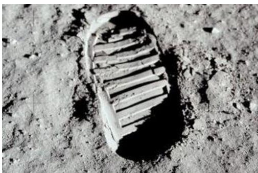
Dấu chân giày con người trên mặt trăng

Mặc dù có những ngày mai sẽ không bao giờ đến, nhưng người ta cũng đừng quên rằng có những ước mơ đã trở thành sự thật. Tám gương người Do-Thái tuổi ngàn năm ( trước năm 1948 ) tha phương cầu thực ở khắp nơi trên thế giới, mà trong lòng lúc nào cũng muốn quay về lại cố hương để quỳ đôi chân dưới bức tường thành Than-Thở ( Le Mur Des Lamentations ), và ngày nay họ đã được hoàn toàn toại nguyện. Hãy nhìn xem hình ảnh của phi thuyền "Apollo 11" đã phá tan huyền thoại của vua nhà Đường du nguyệt điện ở phương Đông, thì phải hiểu rằng giấc mơ bảo tồn bản sắc văn hóa dân tộc bằng phương sách giữ gìn tiếng nói mẹ đẻ của cộng đồng người Việt-Nam ở nước ngoài hôm nay có lẽ phần nào thực tế hơn nhiều. Và chắc chắn cũng sẽ được thực hiện dễ dàng hơn là cả công trình của Ngu-Công dọn núi, nếu nói theo chuyện cổ Bách-Việt hóa.