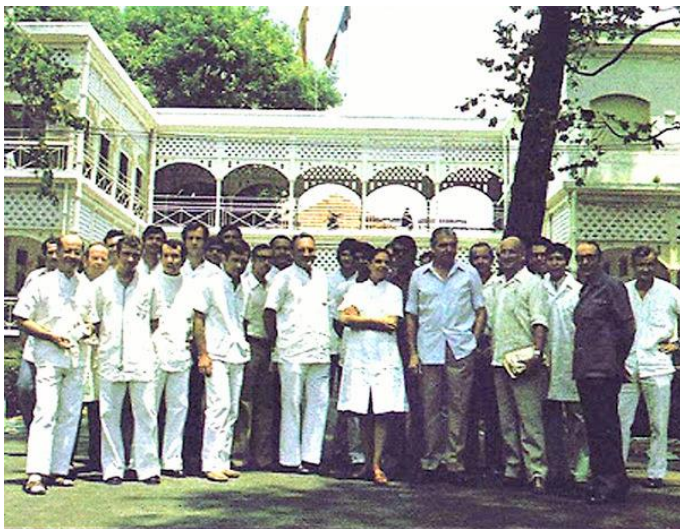
Các bác sĩ Pháp và nhân viên chụp hình lưu niệm tại bệnh viện Grall

Năm 1945, bệnh viện bị trúng bom đồng minh, phá sập các phòng thí nghiệm ở mạn bắc. Mặc dầu người Pháp thua trận Điện Biên Phủ, đầu hàng rút quân theo Hiệp định Genève năm 1954 nhưng chính phủ Pháp sau đó vẫn ký biên bản điều hành bệnh viện Grall, vì chính thể Đế Nhất Cộng Hoà lúc bấy giờ không đủ y bác sĩ. Mặt khác, Sài Gòn vẫn còn nhiều người Pháp sinh sống và làm ăn, Sài Gòn cần có một bệnh viện được trang bị y tế tốt như bệnh viện Grall từng có để phục vụ như một bệnh viện tư nhân quốc tế. Do vậy, dân Sài Gòn nghe nói tới bệnh viện Grall vẫn cho rằng bệnh viện của những người giàu có.