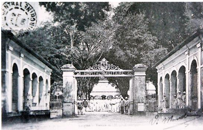
Bệnh viện Hôpital Militaire tức bệnh viện Grall.

Một trong những nhà thương được xây dựng đầu tiên sau khi Pháp chiếm Nam Kỳ, là bệnh viện Grall. Nhà thương nghe bình dân hơn bệnh viện. Người bình dân thậm chí người tri thức vẫn gọi nhà thương như vậy cho đến thời kỳ sau 1975 thì gọi là bệnh viện. Một vài ý kiến cho rằng, nhà thương chẳng qua do tấm lòng y đức của bác sĩ và các nhân viên y tá chăm sóc bệnh nhân tận tình thể hiện tình thương giữa người với người nên hai chữ nhà thương xuất hiện.