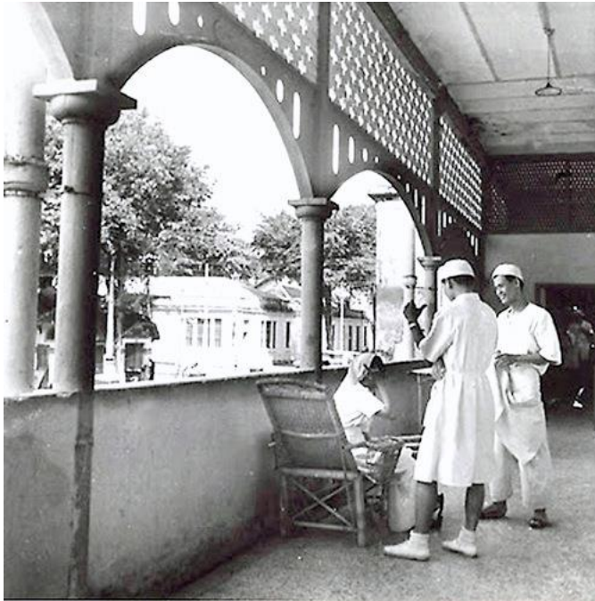
Hiên rộng và trần cao làm thoáng mát bệnh viện.