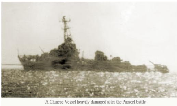
A Chinese Vessel heavily damaged after the Paracel battle

Ta thiệt hại một chiến hạm (HQ 10), ba chiến hạm bị hư hại nhưng vẫn tự vận chuyển được, 18 nhân viên tử thương và 40 bị thương. Địch thiệt hại 1 chiến hạm (Kronstadt 274) và 1 chiến hạm khác số 386 bị hư hại rất nặng, có thể bị chìm và không sửa chữa được. Số nhân viên tử thương và bị thương không rõ, nhưng ước đoán nhiều hơn ta.