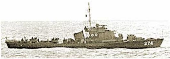
Kronstadt 271 & 274 (Photo taken one hour before the battle from HQ.4)

- Hồi 18:02H, chiến hạm phát hiện 2 tàu lạ loại Hộ Tống Hạm (Kronstadt) mang số 271 và 274 trang bị đại bác 100 ly và 37 ly từ Duncan tiến về Robert. HQ 4 tiến cận các tàu này, thả xuống cao su chớ nhân viên biết tiếng Trung Hoa qua tiếp xúc, nhưng các tàu này không cho cập vào. Chiến hạm gửi quang hiệu yêu cầu các tàu Trung Cộng rời khỏi vùng này nhưng không có kết quả. Tàu Trung Cộng cũng dùng quang hiệu trả lời là các đảo này thuộc chủ quyền của họ và yêu cầu các chiến hạm ta tránh xa. Sau đó các tàu Trung Cộng chạy quanh HQ 4 và vận chuyển chặn đầu chiến hạm, bắt chấp qui luật hàng hải quốc tế. Nội dung các bản văn của tàu Trung Cộng chuyển cho HQ 4 bằng hiệu như sau: