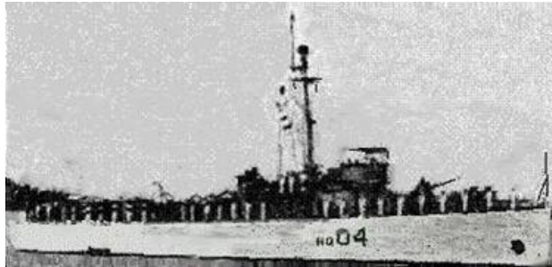
Hộ-tống-hạm Tụy-Động, HQ-04 là chiến-hạm HQ/VNCH đầu-tiên công-tác tuần-tiểu Trường-Sa (22/8/1956).