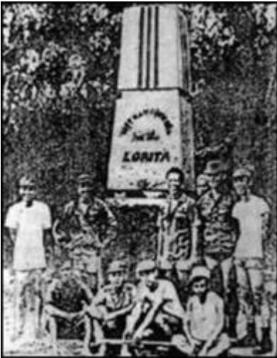
Bia chủ-quyền của Việt-Nam thiết-lập trên đảo Loi-ta