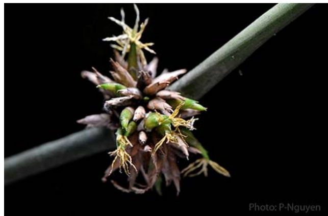
Nụ hoa tre trông giống như những búp măng thu nhỏ.