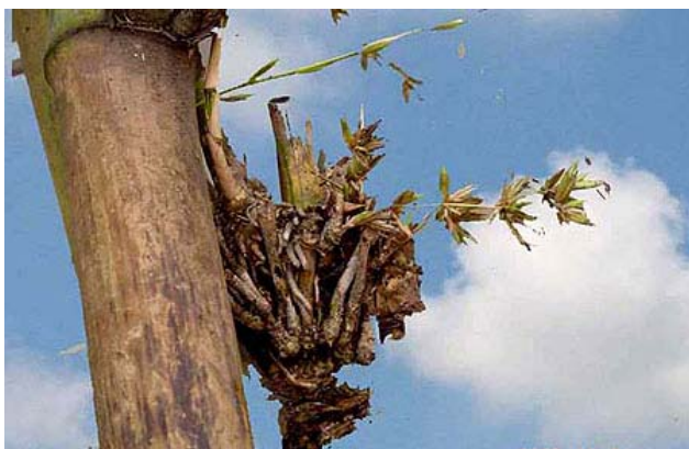
Những đóa hoa nở từ mắt tre già cỗi