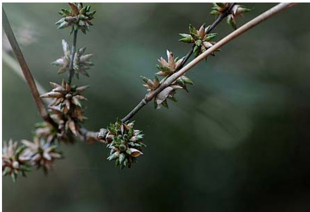
Nụ hoa tre thon dài và cứng cáp