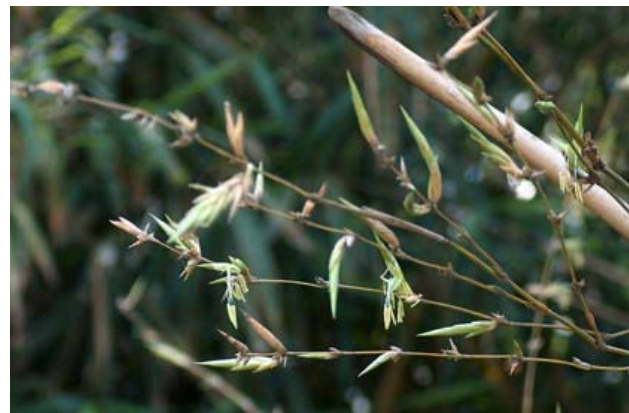
Chu kỳ nở lụng của hoa tre kéo dài từ 60 đến 100 năm, bằng cả một đời người.