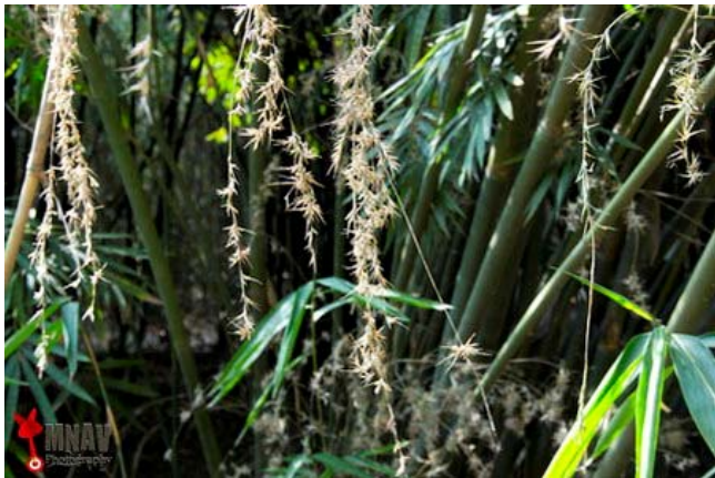
Dáng vẻ thướt tha như những cành liễu rủ.