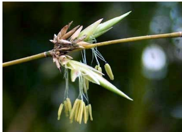
Cận cảnh hoa tre với những nhị vàng lũng lảng