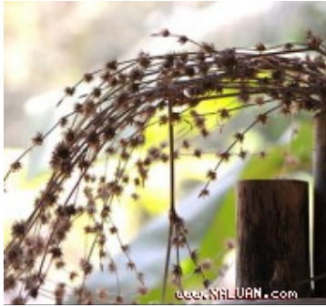
Hoa tre khô trở thành một vật trang trí hiếm có và rất thẩm mỹ

Gần gũi với người Việt nhưng tre lại tồn tại một bí ẩn lớn, mà rất ít người có cơ hội được khám phá - đó là những bông hoa tre.