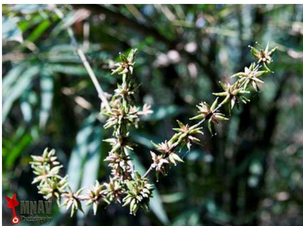
Do rất ít cơ hội bắt gặp, những người được chiêm ngưỡng hoa tre là những người rất may mắn.