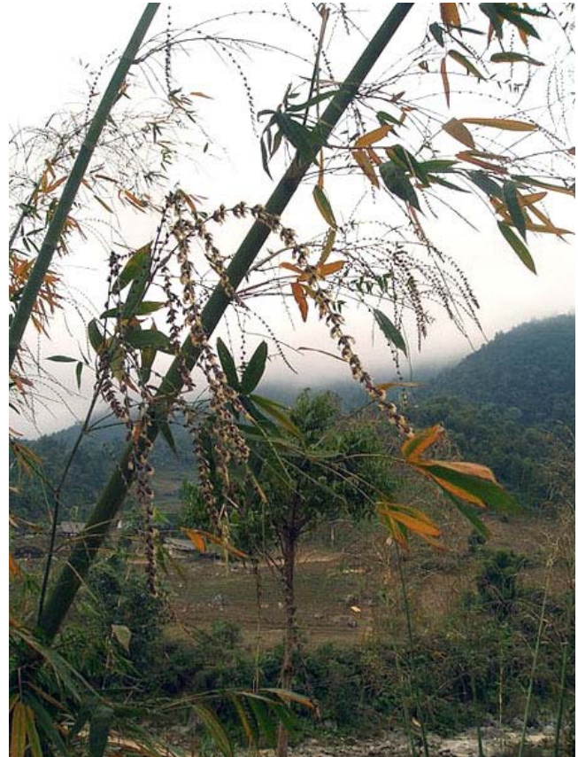
Hoa tre phát phơ trong gió vùng cao.

Hoa tre, loài hoa rất ít người có cơ hội nhìn thấy thường nở thành chùm, có màu vàng, tùy từng loài mà hoa sẽ có sự khác biệt ít nhiều