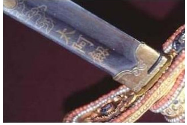
Sóng Việt Đàm Giang