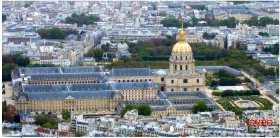
Điện Quốc Gia Phế Binh chụp từ Tòa Eiffel

Hotel des Invalides. Điện Quốc Gia Phế Binh, còn được gọi là Toà Nhà Thường Trú Quốc Gia của Phế Binh, là một cụm tòa nhà tại quận 7 của Paris, Pháp, gồm Bảo tàng viện, dinh thự liên quan đến lịch sử quân đội Pháp, kể cả một nhà thương và nhà nghỉ hưu cho cựu chiến binh chiến tranh. Những tòa nhà này chứa Viện bảo tàng Quân đội, hai viện bảo tàng khác nữa và là nơi chôn cất một số anh hùng chiến tranh của Pháp, đáng kể là Napoleon Bonaparte.