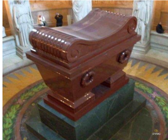
phía trên mộ của Napoleon

The Hôtel des Invalides tọa lạc ở quận 7, phía nam của sông Seine, và bên đông của Ecole Militaire.