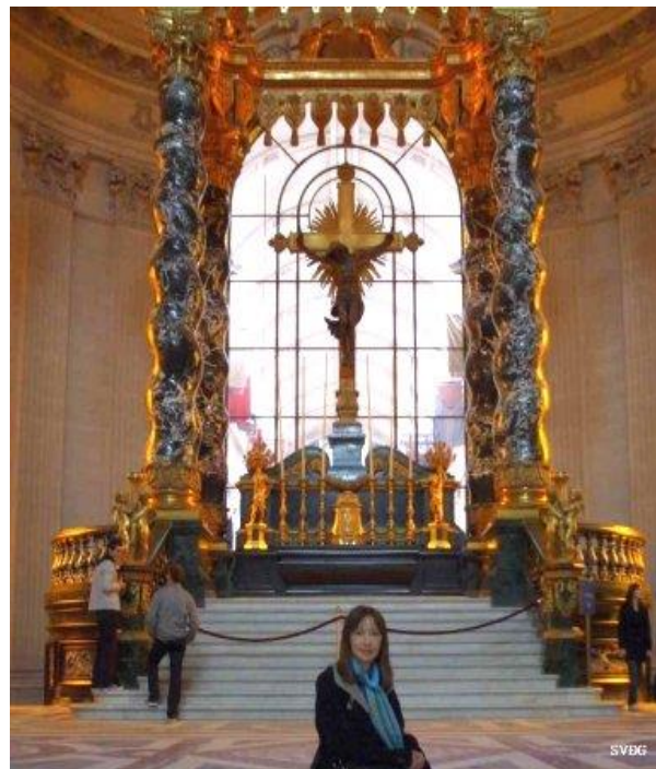
Điện thờ trong nhà vòm hoàng gia

Hiện nay Viện Quốc gia Phế binh ngoài những tòa nhà di tích lịch sử còn tồn tại nhà nghỉ hưu, một trung tâm y khoa và phẫu thuật, và một trung tâm vấn đề y khoa. Tại Les Invalides có ngôi mộ của Napoleon Bonaparte (1769–1821). Napoleon chết trên đảo Saint Helena, nhưng sau đó Vua Louis-Phillippe đã cho mang về Paris vào năm 1840, và sau đó được yên nghỉ ngàn thu trong một ngôi mộ màu nâu đỏ (red quartzite) đặt trên một tấm đá xanh vào năm 1861. Một số thân nhân của gia đình họ Napoleon, rất nhiều sĩ quan quân đội Pháp là việc với Napoleon, và một số anh hùng quân đội Pháp cũng được chôn tại Les Invalides.