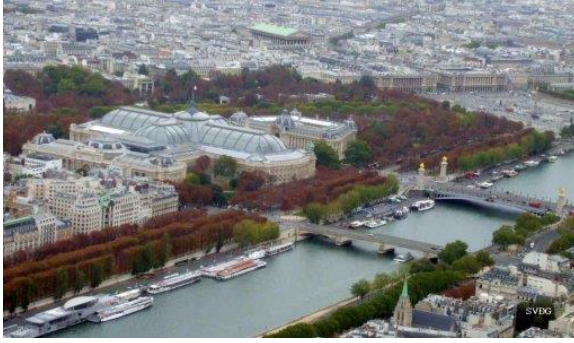
Cầu Invalides và cầu Alexander III

Nếu nhìn từ sông Seine ngược dòng lên thì ta thấy cây cầu Alexander III phía xa đưa tới Petie Palais và Grand Palais. Cầu Invalides thì phía xuôi dòng sông Seine.