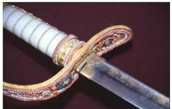
Hình kiếm của Võ Quang Yến (*):