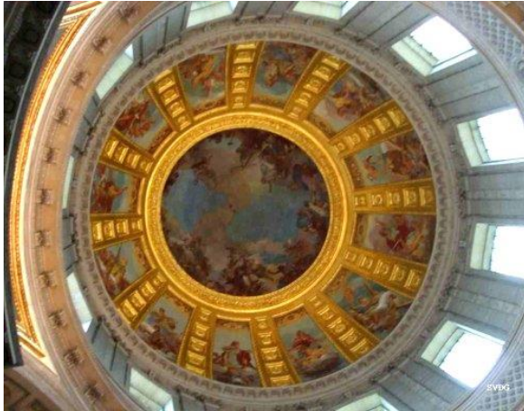
Trần nhà vòm do De La Fosse vẽ

- The Musée de l'ordre de la Libération chứa những tài liệu đặc biệt cho giải phóng nước Pháp trong Đệ nhị Thế chiến, và tượng Charles de Gaulle, vị lãnh tụ của Pháp