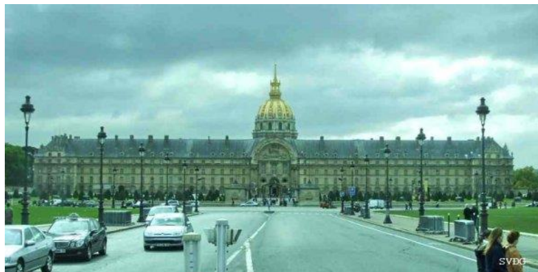
Điện Quốc Gia Phế Binh chụp từ mặt phía bắc, với nhà vòm chế ngự chính giữa hình.

Ngày 24 tháng November 1670, vua Louis XIV ra lệnh cho kiến trúc sư Libéral Bruant vẽ dự án xây cất tòa nhà Quốc gia Phế binh gồm có nhà thương và nơi cư ngụ cho thương phế binh. Nơi chọn lựa là cánh đồng Grenelle. Khi dự án hoàn tất vào năm 1676, mặt tiền nhìn ra sông Seine trải dài 196 m và chung cư trải rộng gồm 15 courtyard, lớn nhất là sân Court of Honor để binh lính diễn hành. Sau đó Jules Hardouin Mansart giúp Bruant lúc này đã già, để xây một nhà nguyện cầu. Nhà thờ hoàn tất năm 1679 sau khi Bruant chết. Nhà thờ cho phế binh mang tên Nhà thờ Saint-Louis của Phế binh. Sau khi nhà thờ này hoàn tất thì vua Louis XIV ra lệnh cho xây một nhà thờ riêng dành cho hoàng gia mang tên Nhà thờ nhà Vòm (Église du Dôme). Nhà thờ này được Mansart xây cất dựa theo nhà Vòm Saint Peter's Basilica ở Rome. Nhà thờ hoàng gia này được hoàn tất vào năm 1708, 27 năm sau khi nhà thờ chính hoàn tất. Trong nhà vòm, Charles de la Fosse là họa sĩ đã vẽ tranh họa cho trần nhà vào năm 1705. Nhà vòm này cao 107 m. Nhìn hình thì ta thấy nhà vòm ở phía sau đã chế ngự và nổi bật hòa hợp với vòng cung cửa của tòa nhà do Bruant xây.