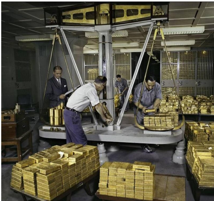
Nhân viên cân vàng trước khi đưa vào kho năm 1959. Ảnh: FED.

Theo số liệu năm 2019, kho 3 tầng này chứa 497.000 thỏi vàng, với tổng trọng lượng khoảng 6.190 tấn. Điều thú vị là chỉ khoảng 5% số vàng này thuộc về chính phủ Mỹ, còn lại là tài sản của ngân hàng trung ương quốc gia khác và các tổ chức quốc tế. Kho có 122 khoang chứa vàng, mỗi khoang thuộc về một tài khoản, cũng như nhiều giá để khác cho những tài khoản nhỏ hơn. Cục Dự trữ Liên bang Mỹ (FED) không công khai về tên tuổi cũng như lượng vàng mỗi tài khoản sở hữu tại đây. Tất cả được định danh bằng số, không có tên. Các thỏi vàng cũng được cân và kiểm tra độ tinh khiết mỗi khi nhập kho.