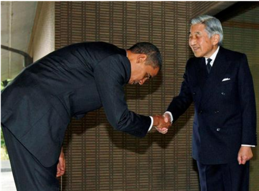
Người vái tứ phương

BARACK OBAMA: 'WE DIDN'T HAVE A SCANDAL THAT EMBARRASSED US' IN MY PRESIDENCY