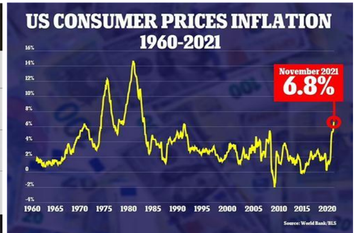
Lạm phát Mỹ cao nhất từ 40 năm